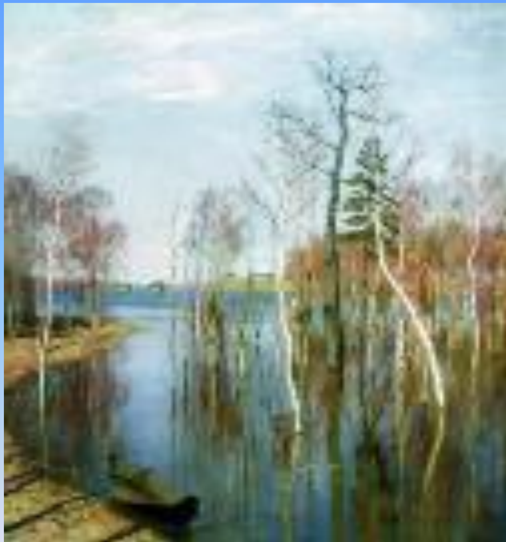
Весна. Большая вода