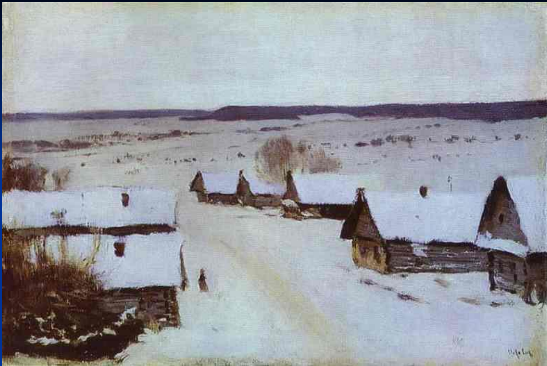
Деревня зимой. Исаак Левитан