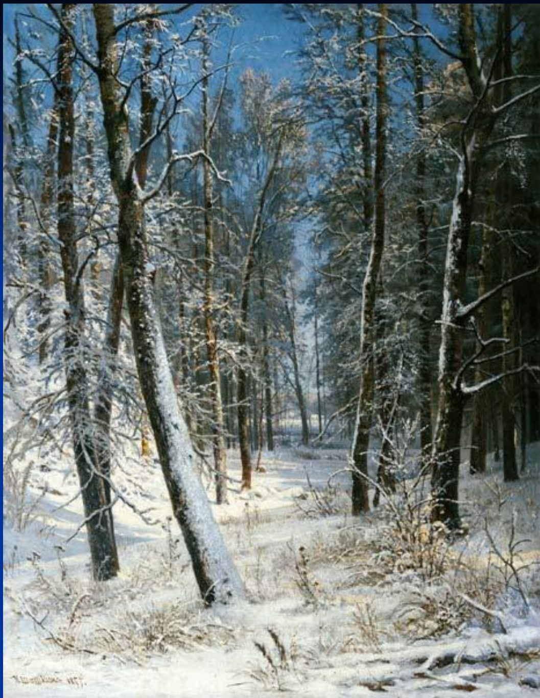
Зима в лесу. Иней. И.И.Шишкин