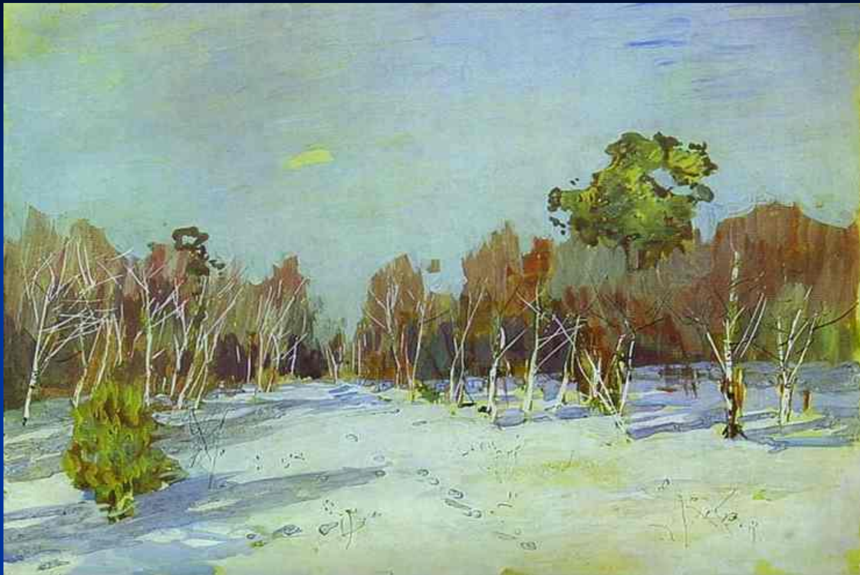
Занесённый снегом парк. Исаак Левитан