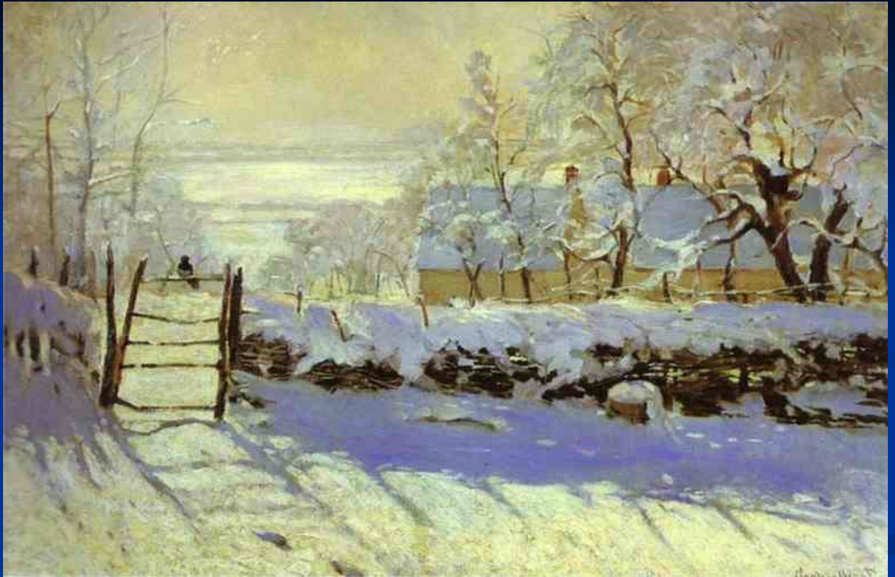
Сорока. Клод Моне