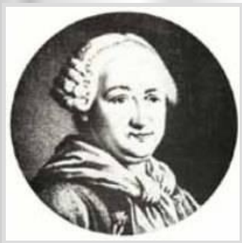
Максим Березовский (1745 – 1777)