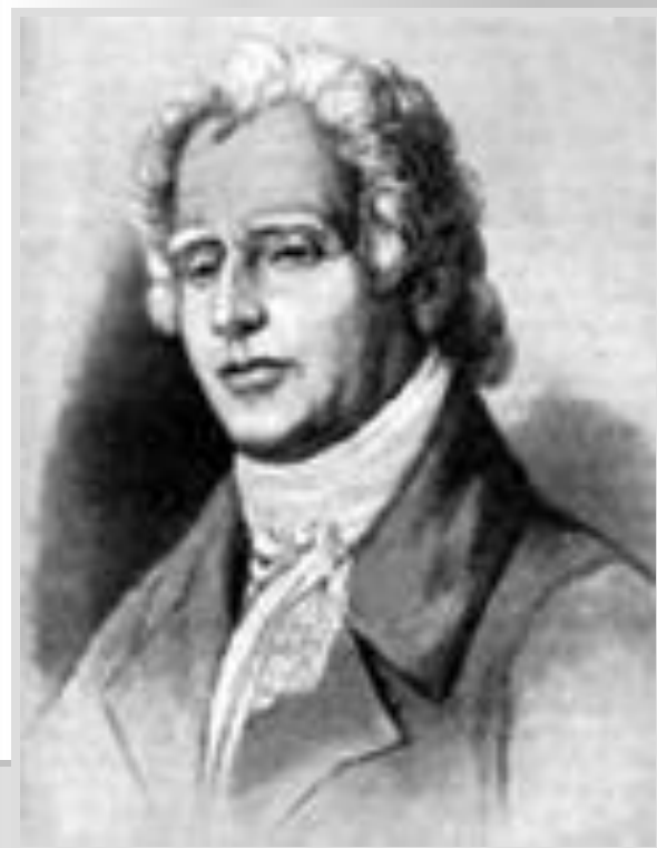
Дмитрий Бортнянский (1751 – 1825)