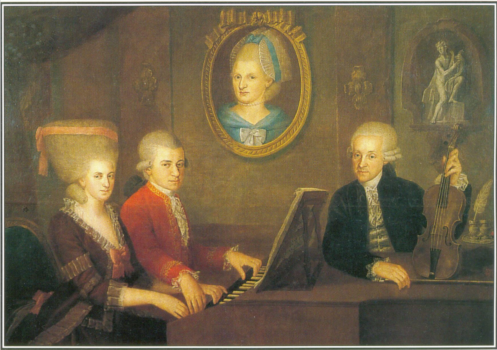
Семья В. А. Моцарта