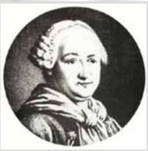
Максим Березовский (1745 – 1777)