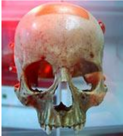
Череп Моцарта в Зальцбургском музее