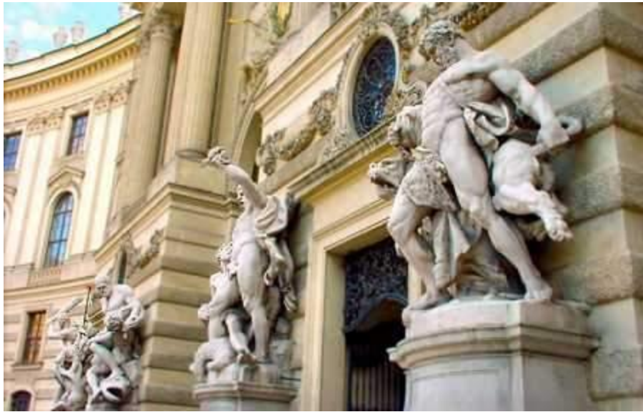
императорский дворец в Вене: скульптуры у входа