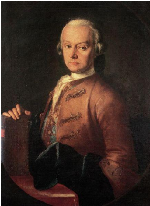
Леопольд Моцарт отец