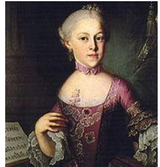
Мария Анна Моцарт, старшая сестра Вольфганга Моцарта