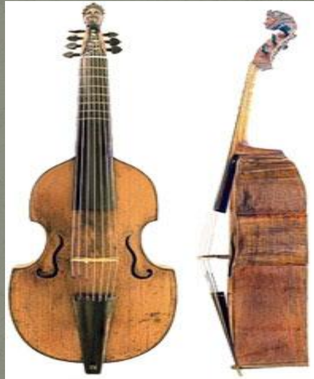
Виола да гамба