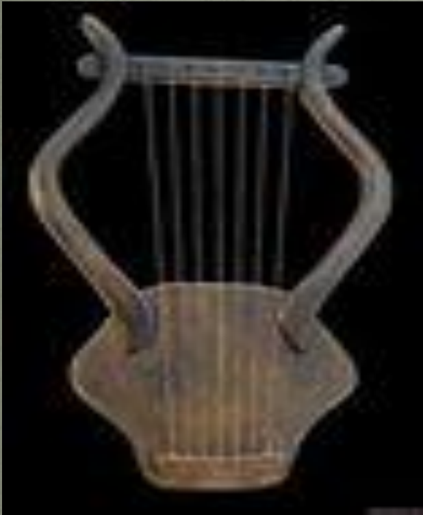
Виола да браччо