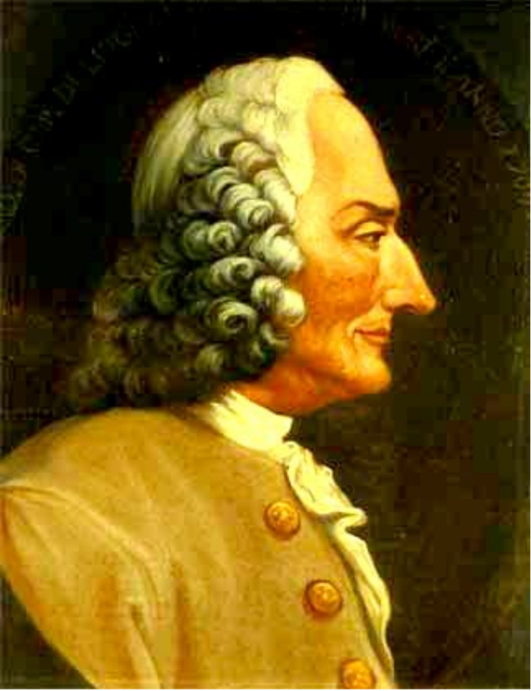
Жан Филипп Рамо