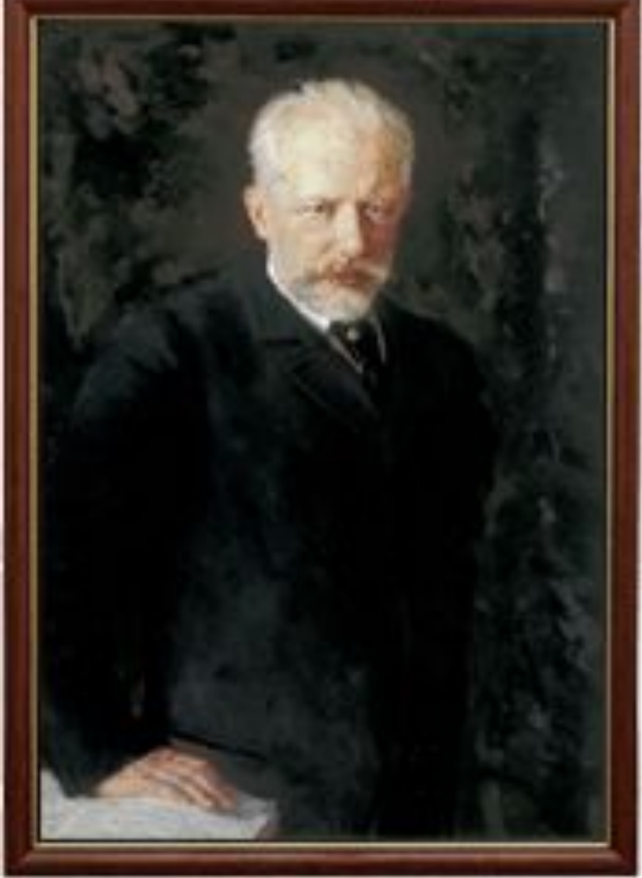
Петр Ильич Чайковский (1840-1893)