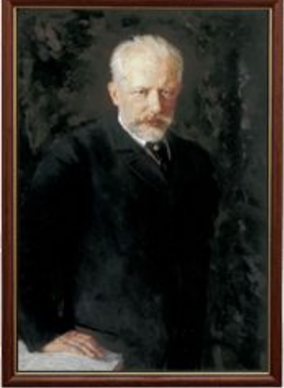
Петр Ильич Чайковский (1840-1893)