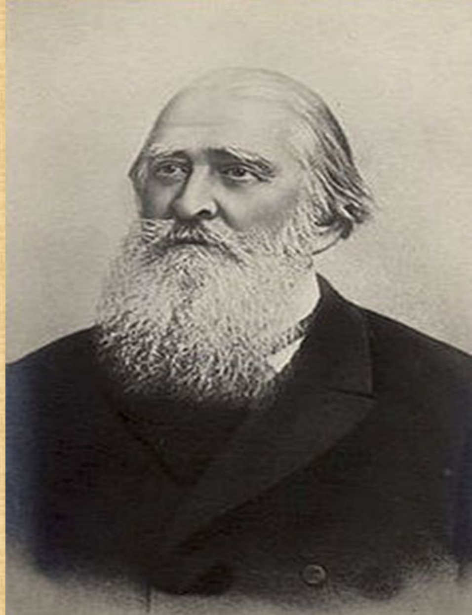
Алексей Николаевич Плещеев (1825-1893)