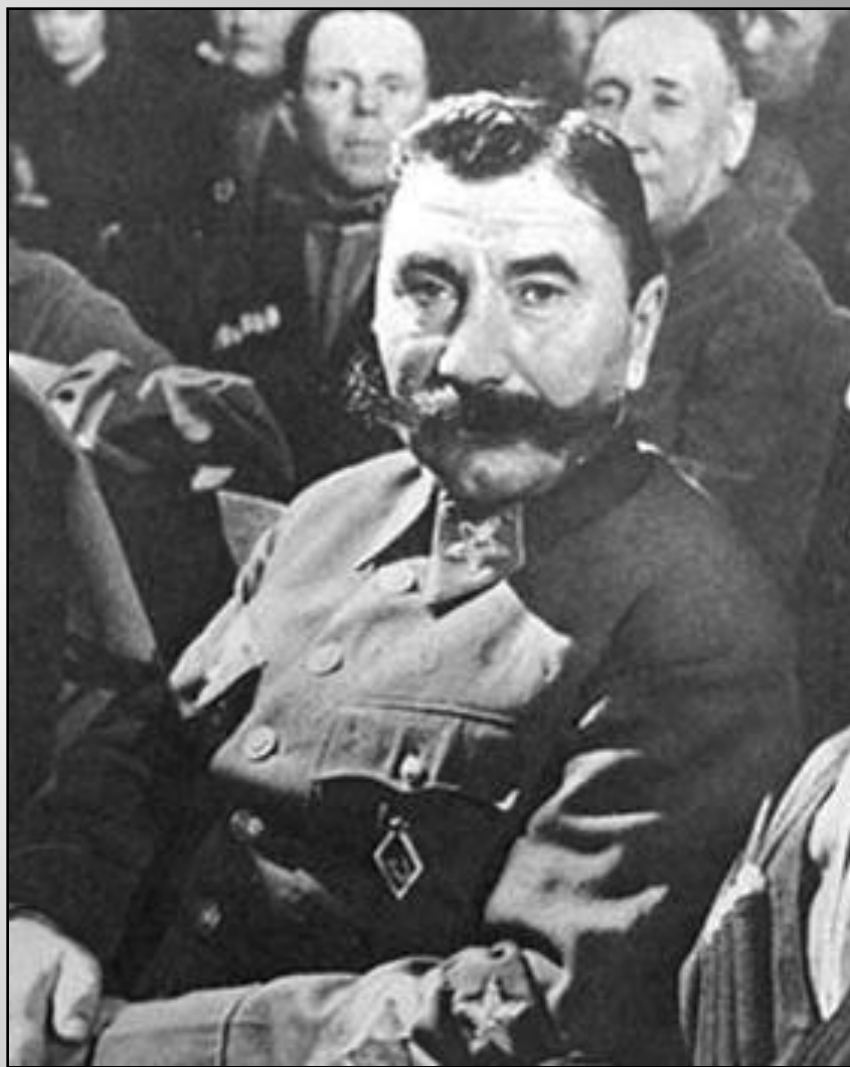
С. М. Буденный