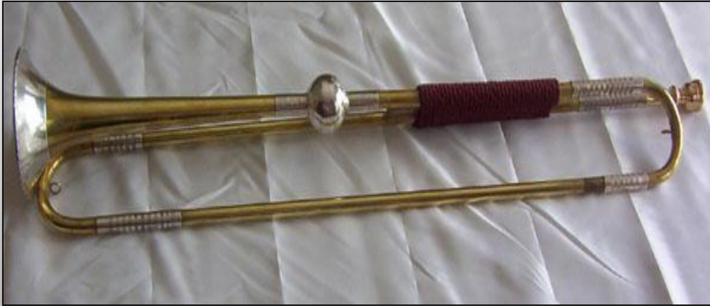
Труба эпохи барокко (реконструкция)