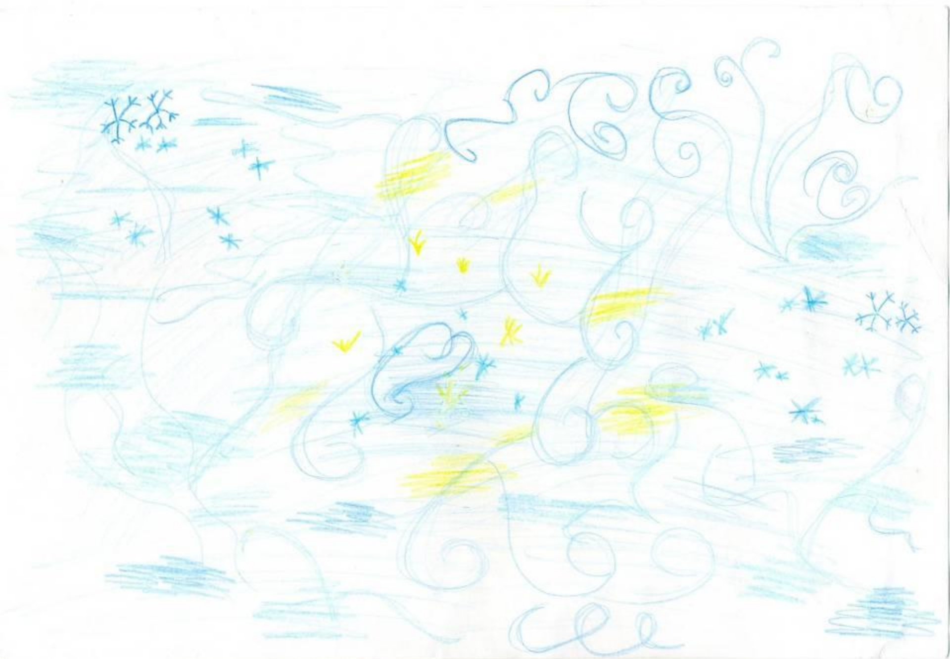
П.И. Чайковский. Декабрь «Святки»