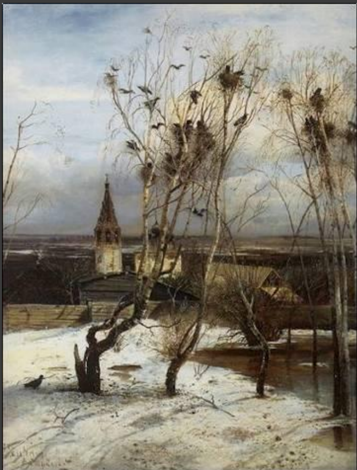
А.К. Саврасов «Грачи прилетели».