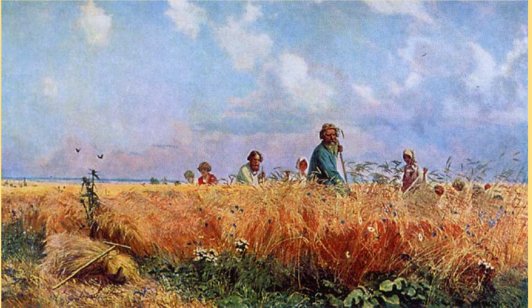
Г.Г. Мясоедов «Косцы».