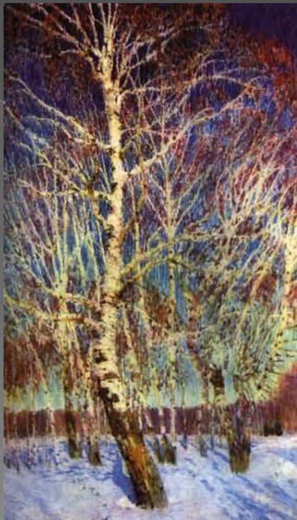
И.Э. Грабарь «Февральская лазурь».