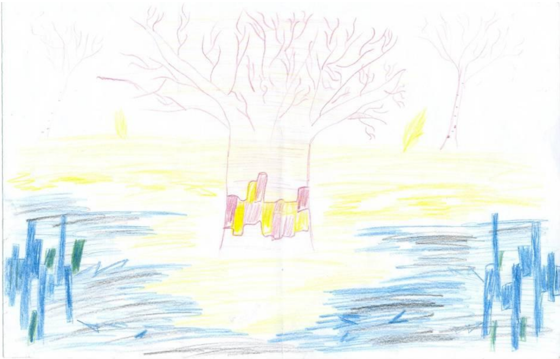
А.П. Бородин. «Богатырская»