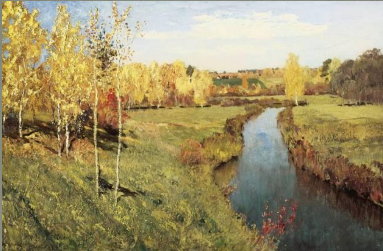
И.И. Левитан «Золотая осень»