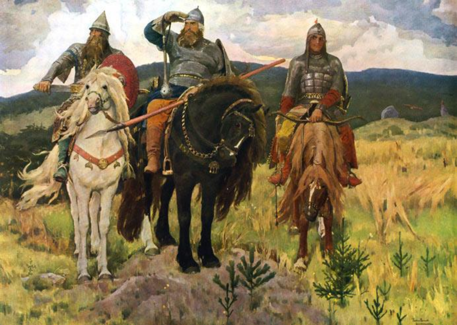
В.М. Васнецов «Три богатыря».