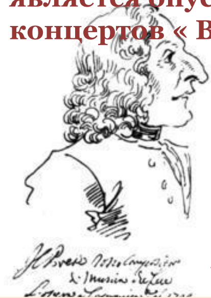
Карикатура на Вивальди «Рыжий священник»

90 опер. Его наиболее известным сочинением является опус из четырёх скрипичных концертов «Времена года».