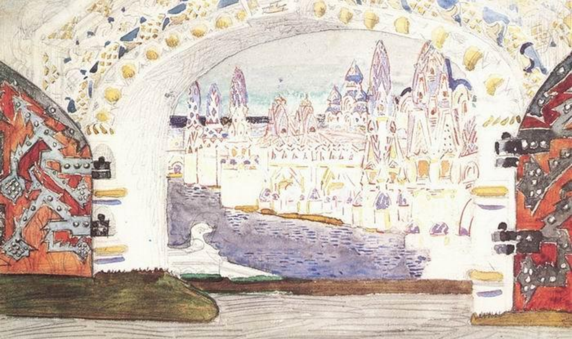
Эскиз декорации. Город Леденец 1900 год.