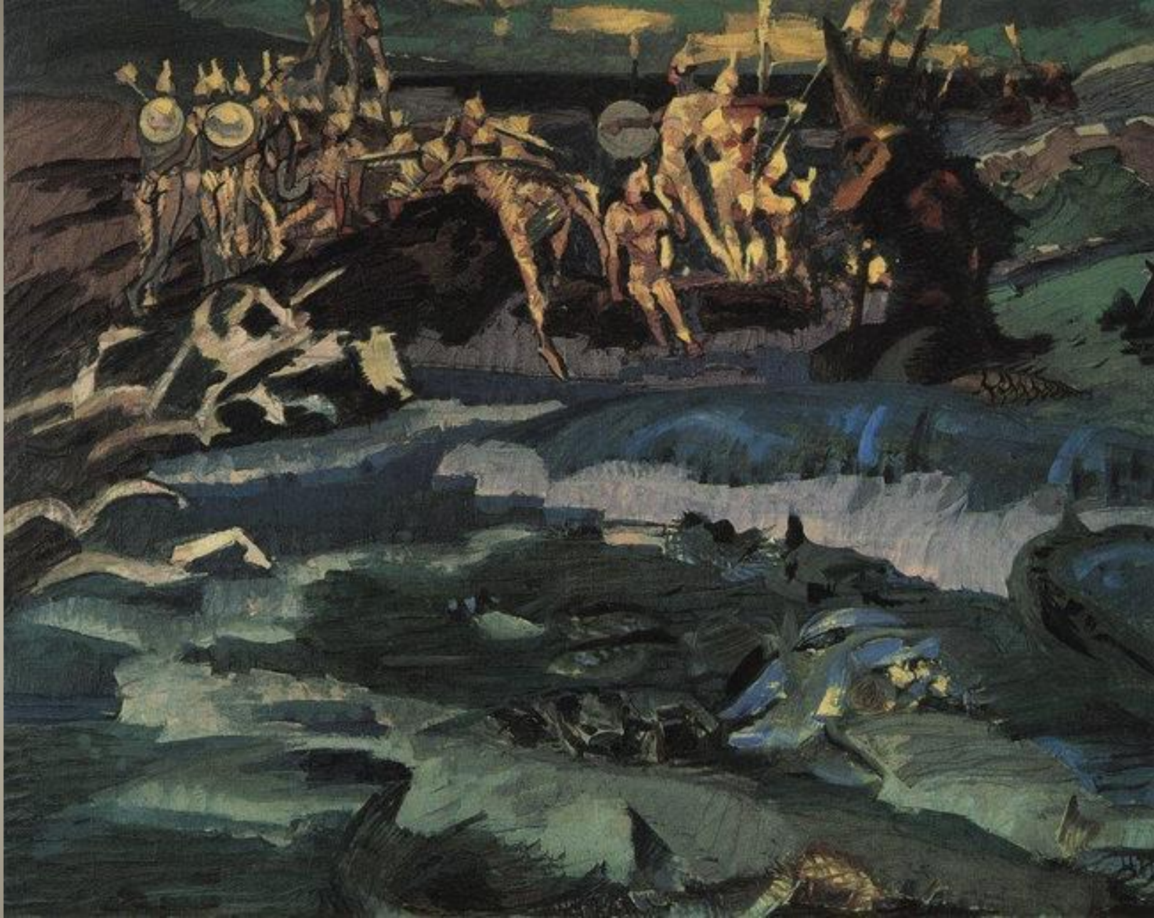
Тридцать три богатыря.