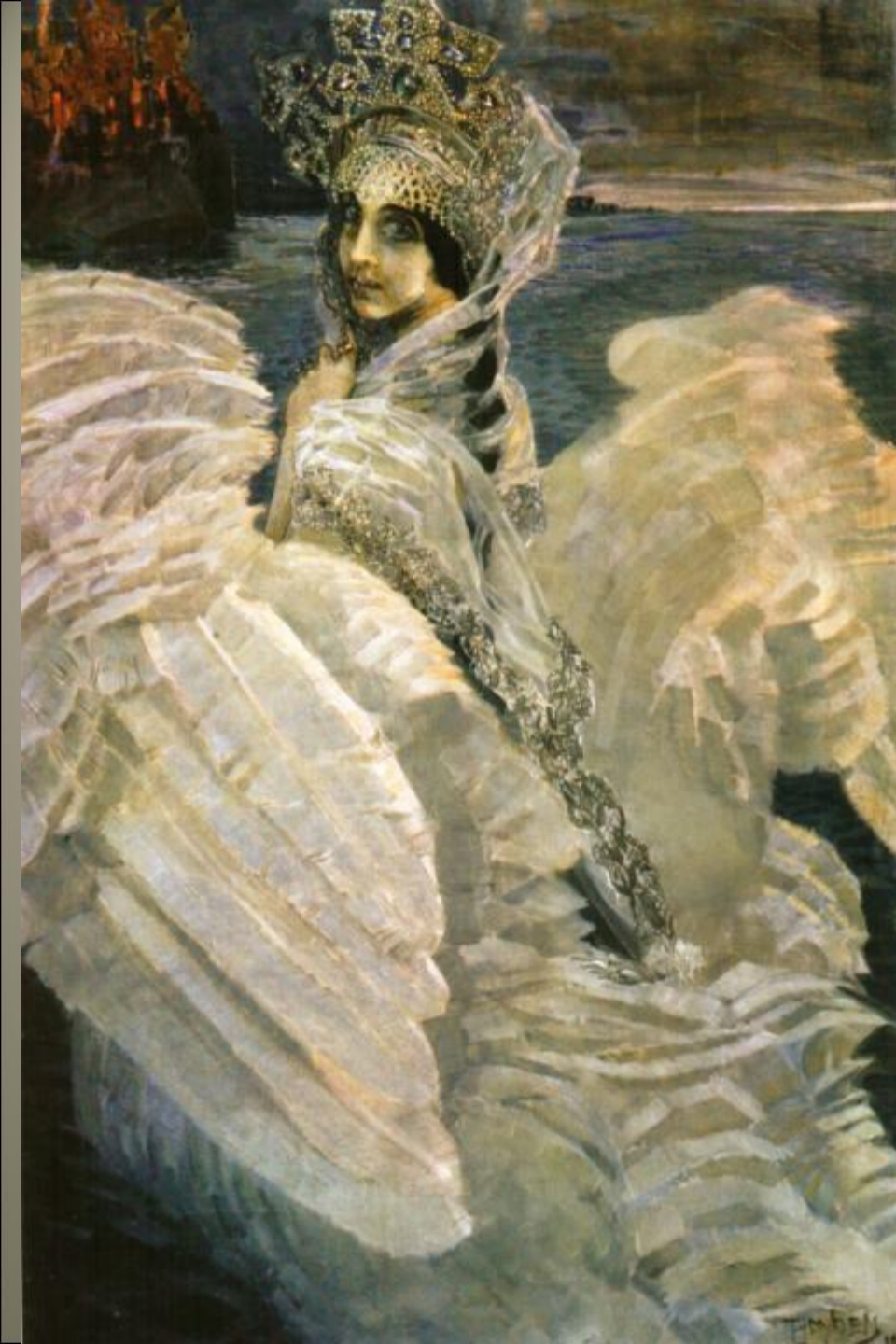
Н.И. Забела-Врубель в роли Царевны – Лебедь. Портрет работы М. Врубеля