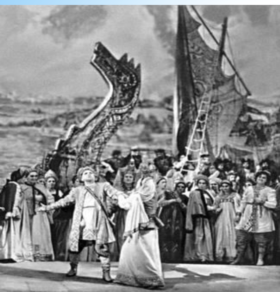
"Садо" Н.А. Римский-Корсаке картина Т-е