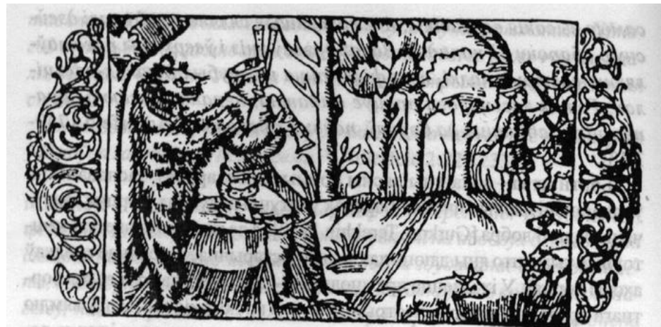
53. Беларускія скамарохі на гравюры Олаўса Магнуса. 1555 г.

пЕрЕдЪ мЕнЕ скачУтЪ на сви нѣхъ вЕрхами сразнымъ мѣзъыкц и гѣдкѣми