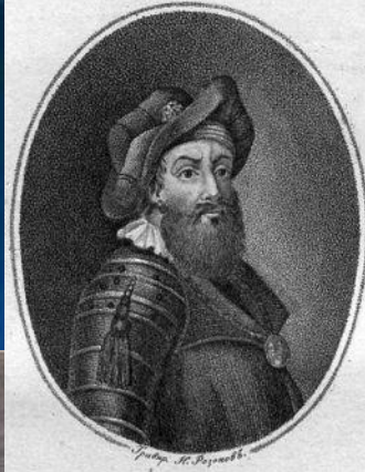
Ермак Тимофеевич, Донской Козакъ, Покоритель Сибири.