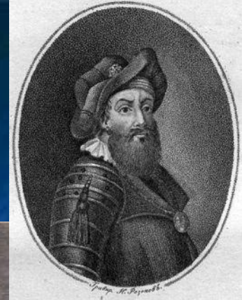
Ермак Тимофеев, Донской Козакъ, Покоритель Сибири.