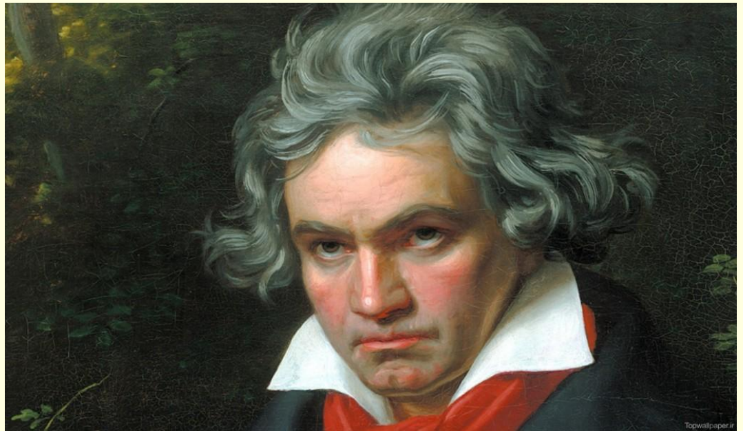
Л. В. Бетховен