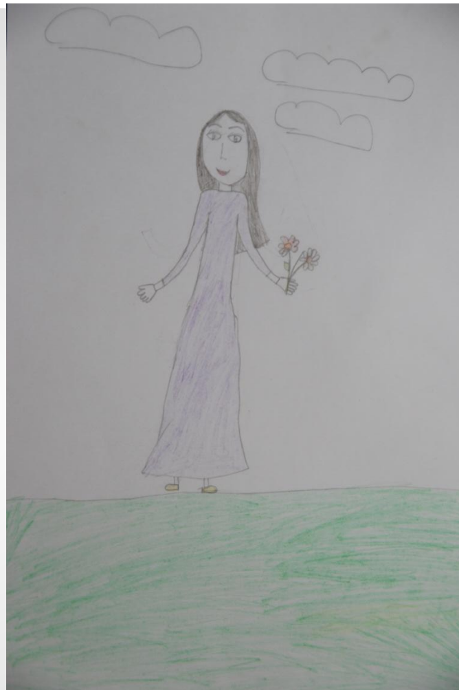
Портрет мам в исполнении учеников 4 «Б» класса