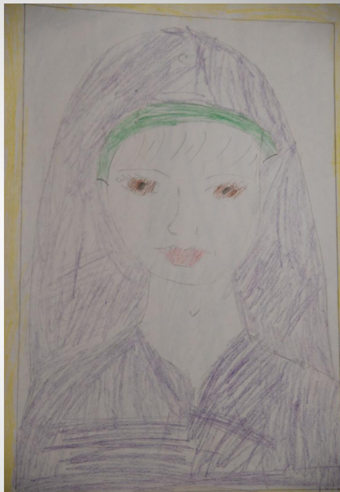
Портрет мам в исполнении учеников 4 «Б» класса