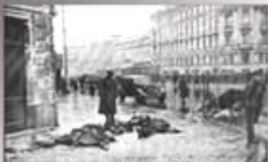
Жертвы первой обстрелки на углу Невского и Литейского проспектов. Сентябрь 1941.