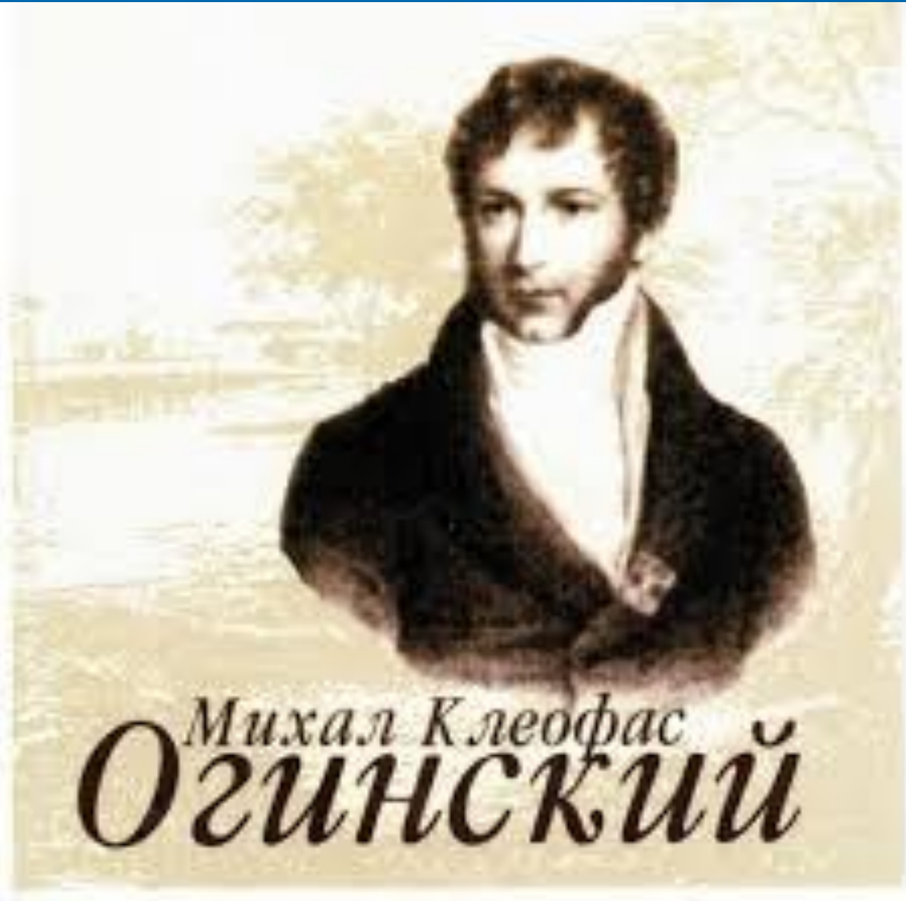
Михал Клеофас ОГИНСКИЙ