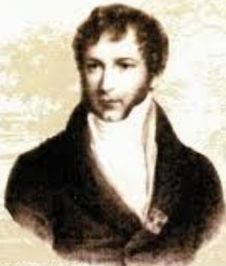
Михал Клеофас ОГИНСКИЙ