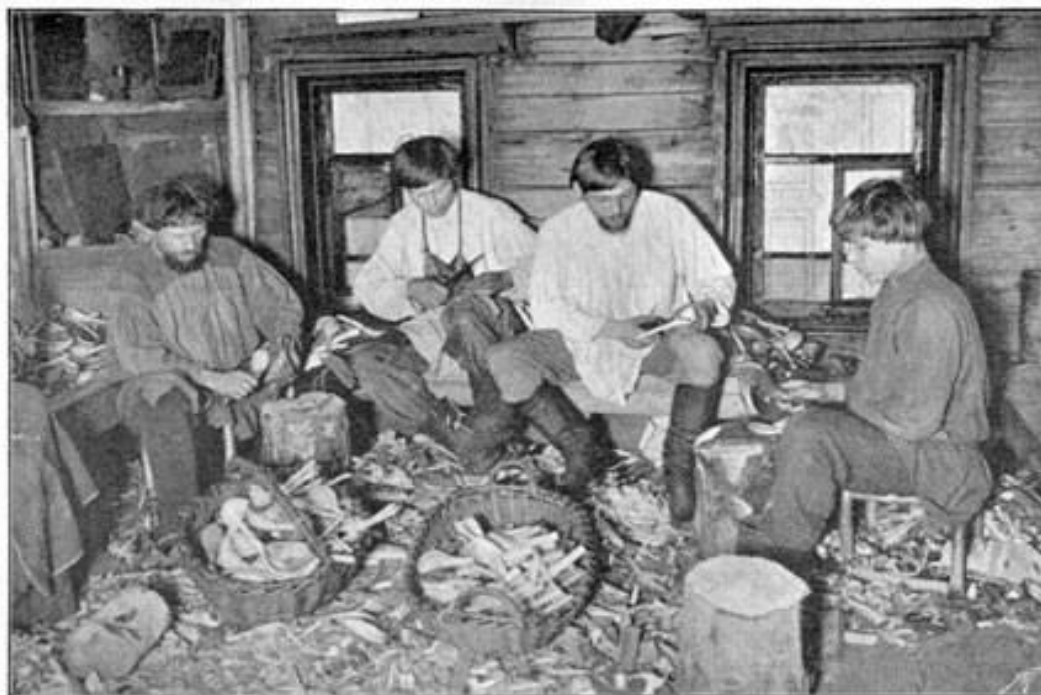
Выдѣлка ложки. Севеноская у.

РУССКИЕ УМЕЛЬЦЫ ВСЕГДА СЛАВИЛИСЬ СВОИМ МАСТЕРСТВОМ ХУДОЖЕСТВЕННОЙ РЕЗЬБЫ ПО ДЕРЕВУ. НА ПРОТЯЖЕНИИ СТОЛЕТИЙ ИЗ ПОКОЛЕНИЯ В ПОКОЛЕНИЕ ОНИ ПЕРЕДАВАЛИ СЕКРЕТЫ СВОЕГО УМЕНИЯ ИЗГОТОВЛЯТЬ ДЕРЕВЯННЫЕ ЛОЖКИ.