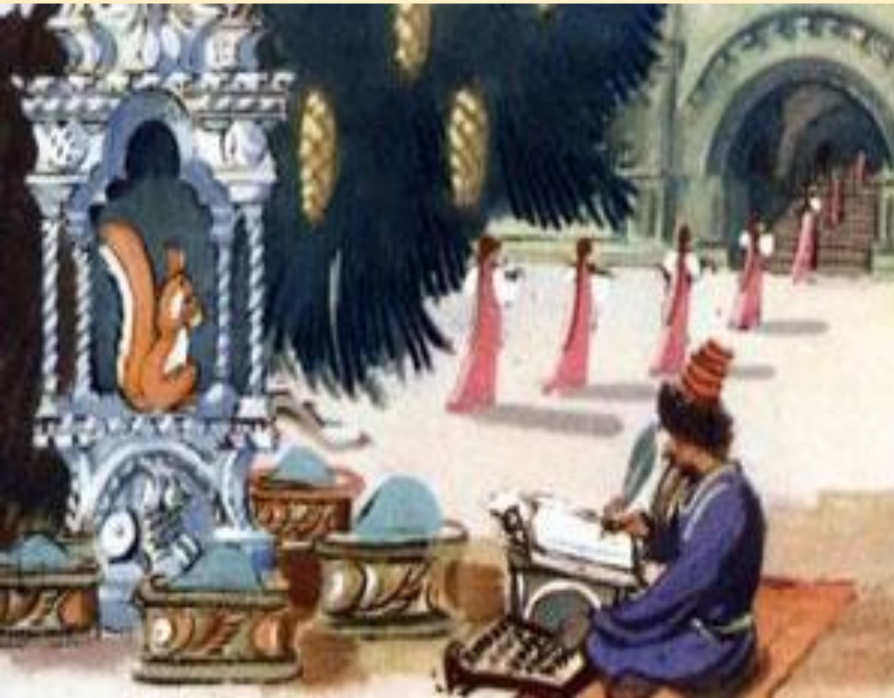
Иллюстрация к сказке А.С. Пушкина «Сказка о царе Салтане»

Ель растёт перед дворцом, А под ней хрустальный дом; Белка там живёт ручная, Да затейница какая! Белка песенки поёт Да орешки всё грызёт, А орешки не простые, Всё скорлупки золотые, Ядра — чистый изумруд