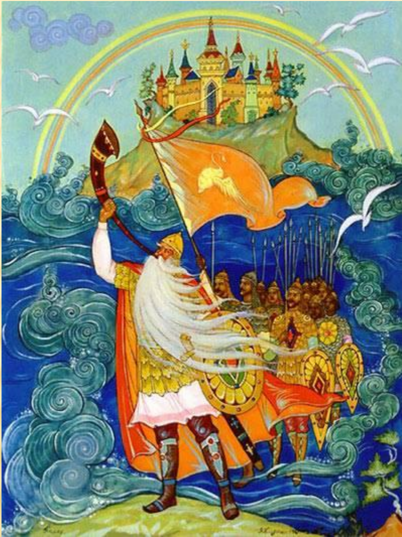
Иллюстрация к сказке А.С. Пушкина «Сказка о царе Салтане»

В свете есть иное диво: Море вздуется бурливо, Закипит, подымет вой, Хлынет на берег пустой, Разольётся в шумном беге, И очутятся на бреге, В чешуе, как жар горя, Тридцать три богатыря, Все красавцы удалые, Великаны молодые, Все равны, как на подбор, С ними дядька Черномор.