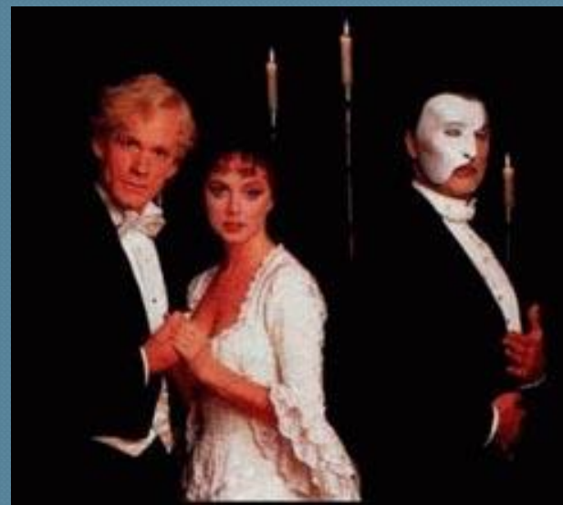
Э.Л.Уэббер мюзикл «Призрак оперы»