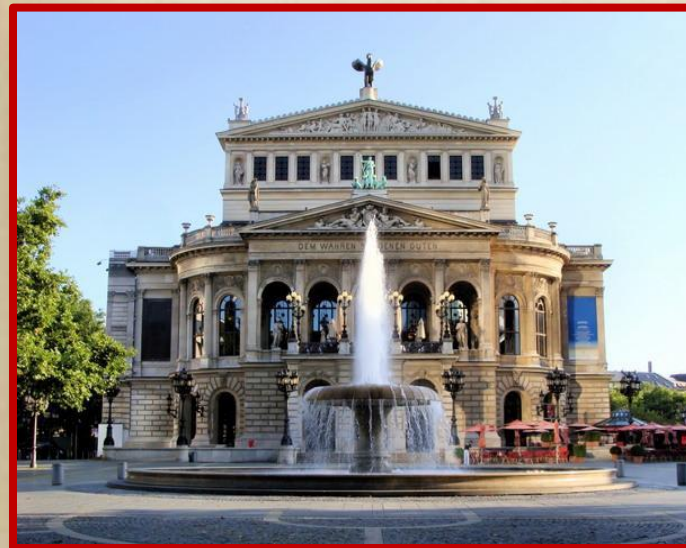
Старинное здание оперы

Опера появилась в Италии, в мистериях, то есть духовных представлениях, в которых эпизодически вводимая музыка стояла на низкой ступени. Духовная комедия: «Обращение св. Павла» (1480), Беверини, представляет уже более серьёзный труд, в котором музыка сопровождала действие с начала до конца. В середине XVI века большой популярностью пользовались пасторали или пастушеские игры, в которых музыка ограничивалась хорами, в характере мотета или мадригала. В «Amfiparnasso», Орацио Векки хоровое пение за сценой, в форме пятиголосного мадригала, служило для сопровождения игры актёров на сцене. Эта «Commedia armonica» была дана в первый раз при Моденском дворе в 1597 году.