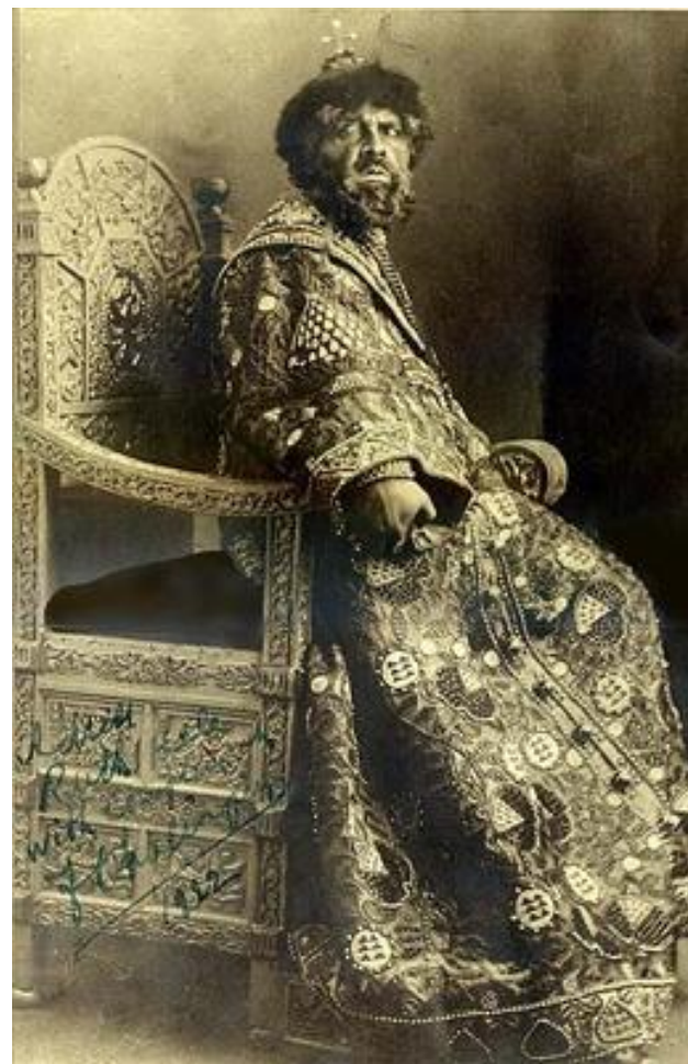
Ф.И.Шаляпин в роли Бориса Годунова.