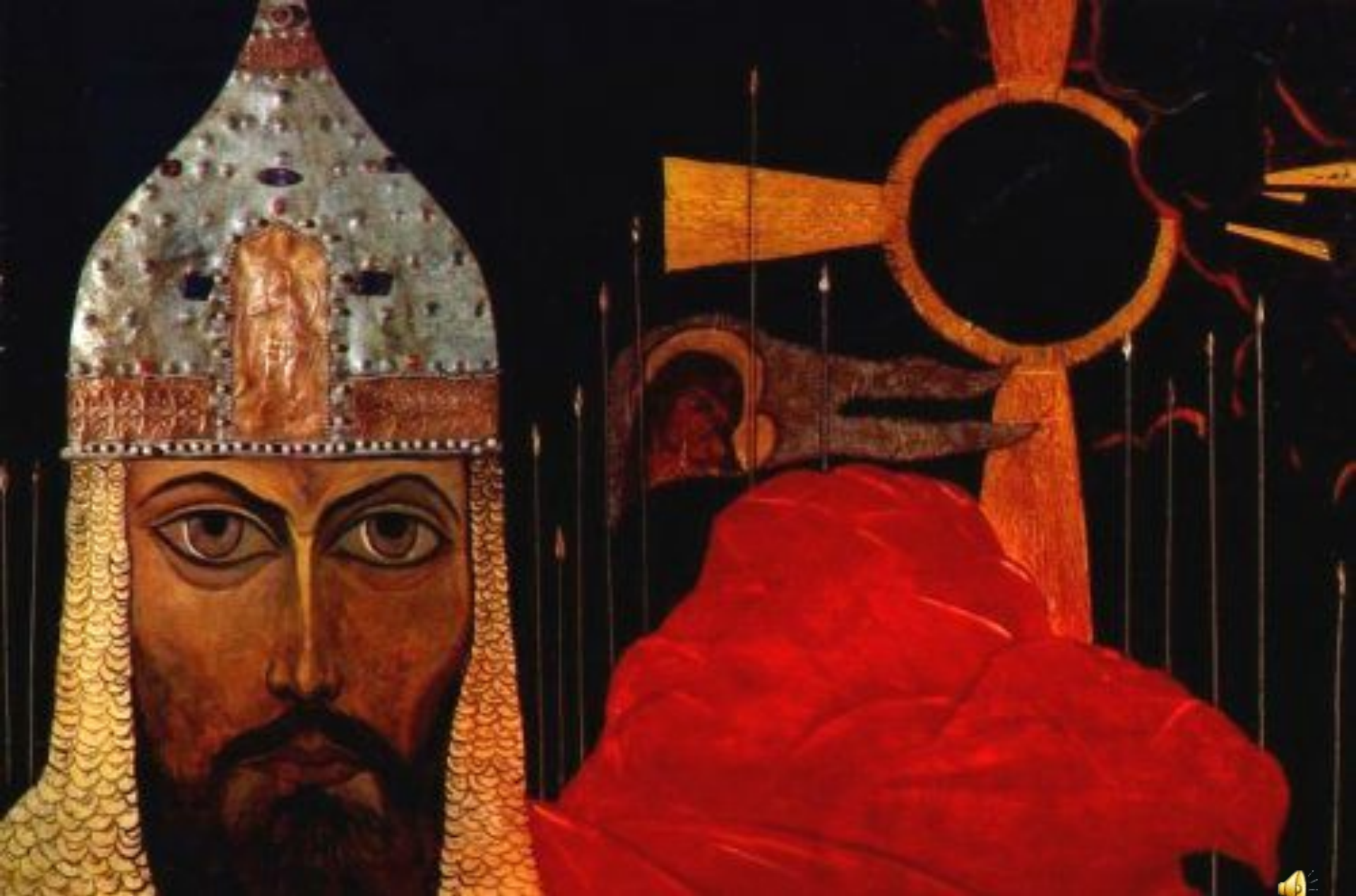
Н.К.Рерих "Поход Игоря". 1942. и «Князь Игорь» Государственный Русский музей.