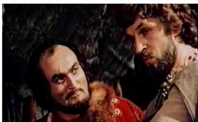
А.П.Бородин. Князь Игорь. Фильм-опера