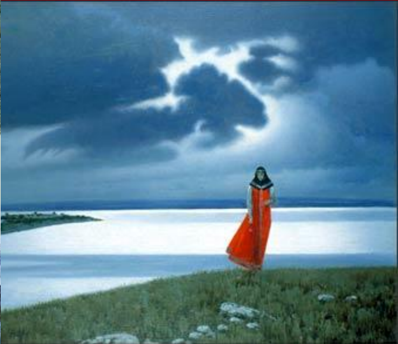
Константин Алексеевич ВАСИЛЬЕВ. «Плач Ярославны»