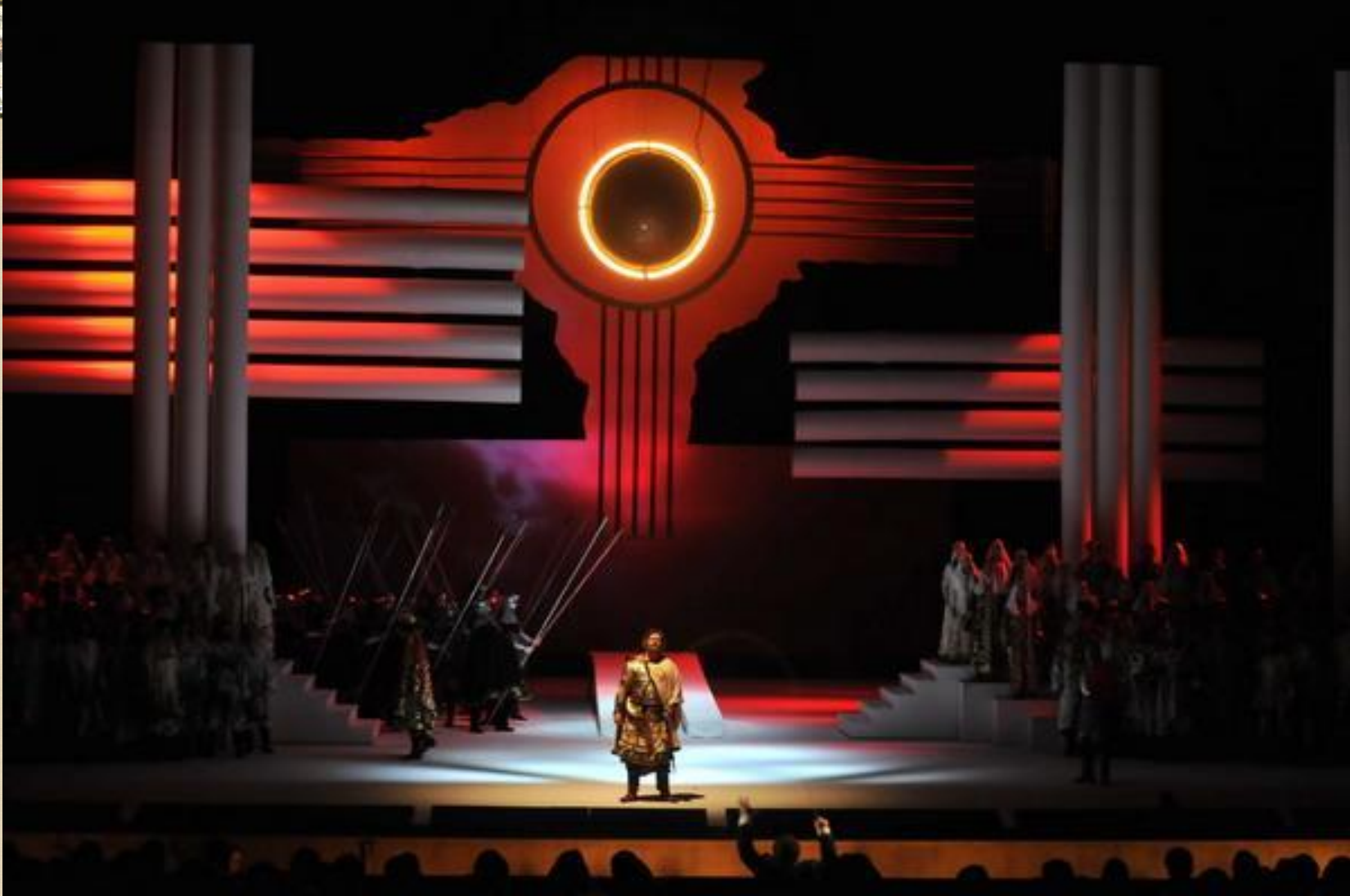
Сцена солнечного затмения