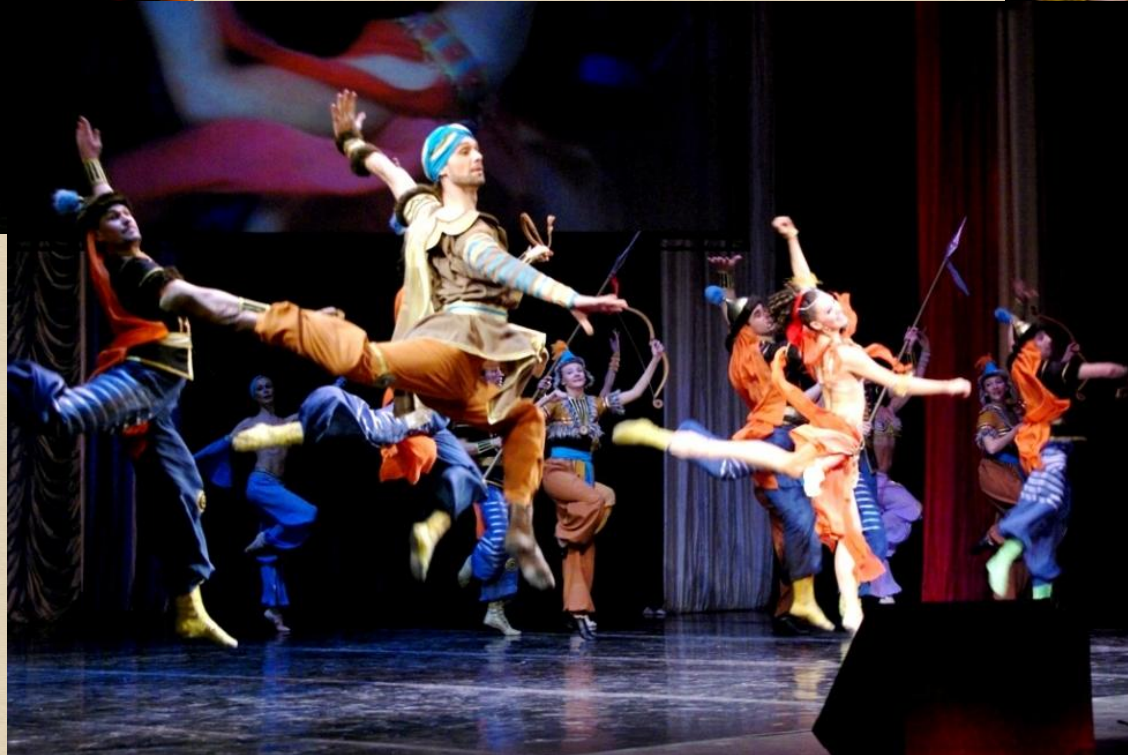
Сцена половецких плясок