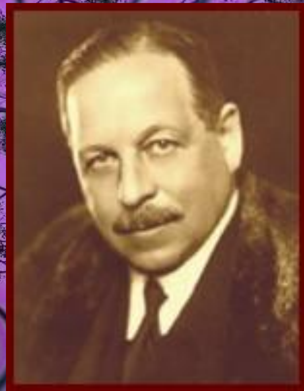
Имре Кальман (1882 — 1953 г.г.)