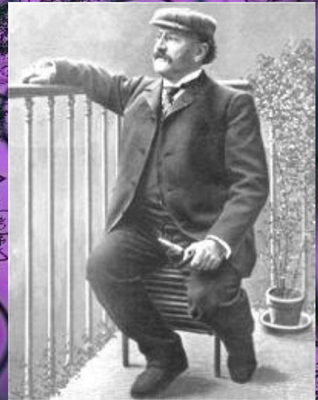
Робер Планкетт (1848 – 1903 г.г.)