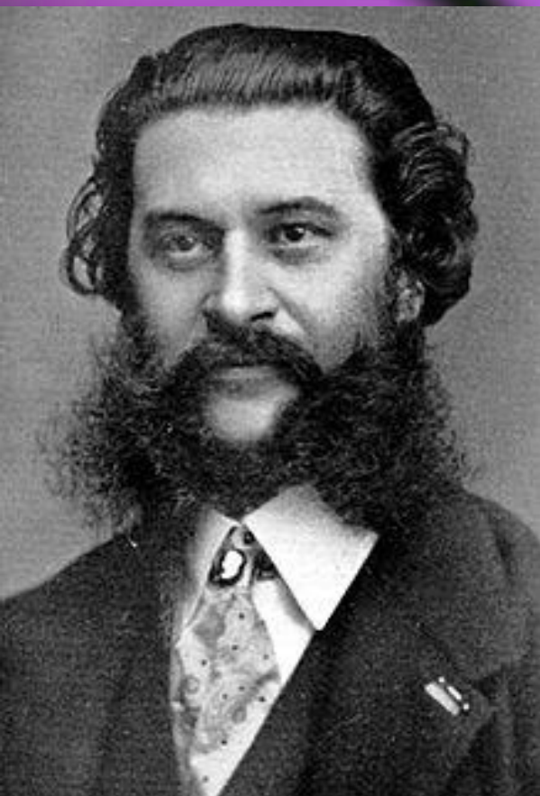
Иоганн Штраус (1825—1899 г.г.)