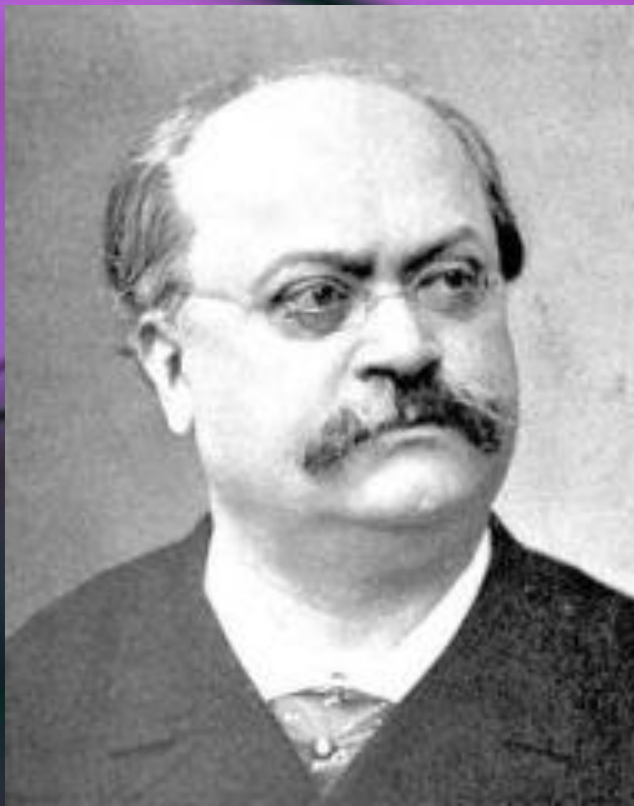
Шарль Лекок (1832 – 1918 г.г.)