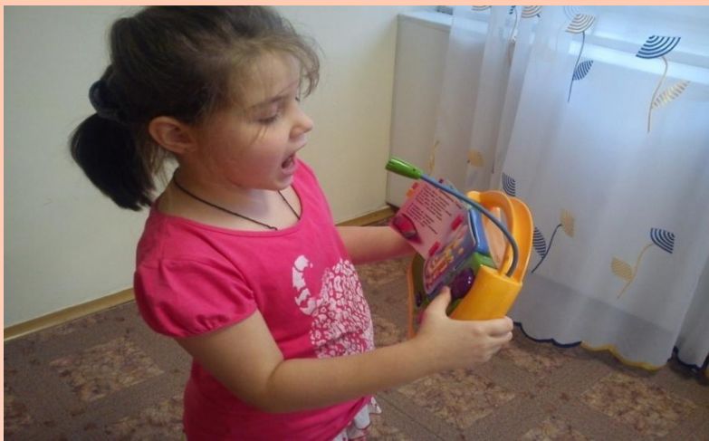
Игра «ВЫКЛЮЧЕННЫЙ МИКРОФОН»