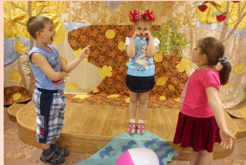
Игра «ПЛАЧ» - на передачу различных эмоций – удивление, горе, сочувствие, радость.