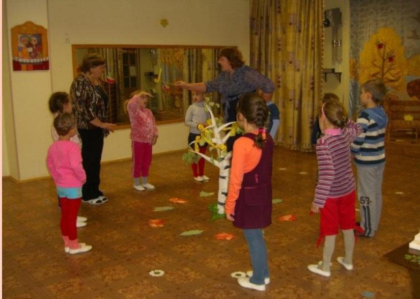
Игра «ВОЛШЕБНАЯ ПАЛОЧКА»