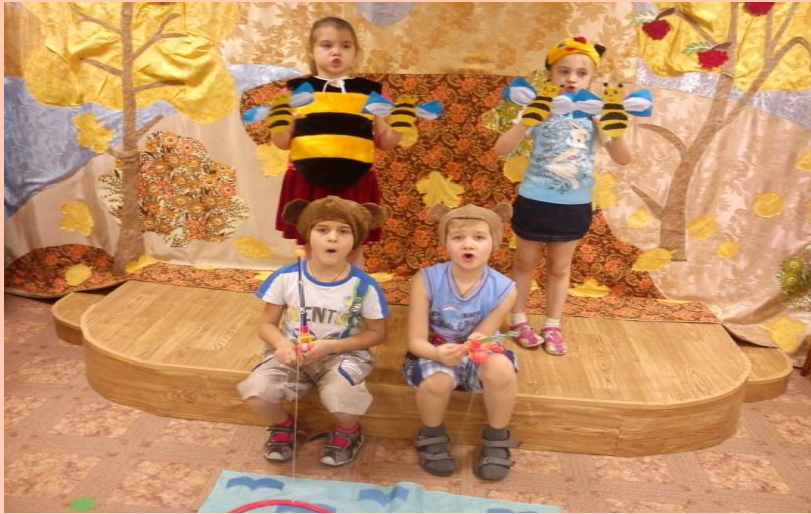
Игровое распевание «МЕДВЕЖОНОК И ПЧЕЛА» - на артистические способности.