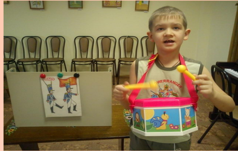
Игра «СОЛДАТЫ» - на узнавание песен по графическому изображению ритма или по отстукиванию ритма.