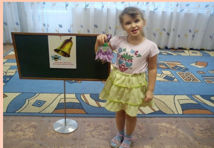
Игра «КТО КОГО ПЕРЕПОЁТ»