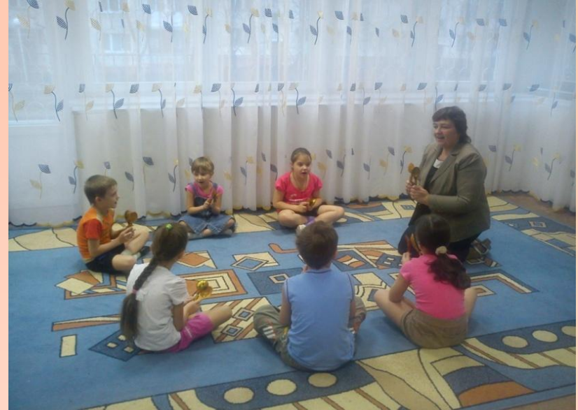
Игра «ЛОЖКАРИ» - на развитие слухового внимания и чувства ритма.