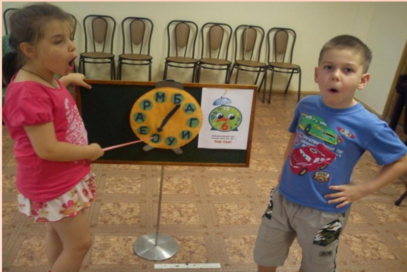
Упражнение «ПОЮЩИЕ ЧАСЫ» - на формирование слогов, закрепления букв.