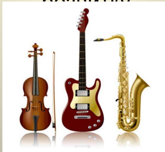
Вершиніна Л.Х. - вчитель музики Родинська ОШ№8