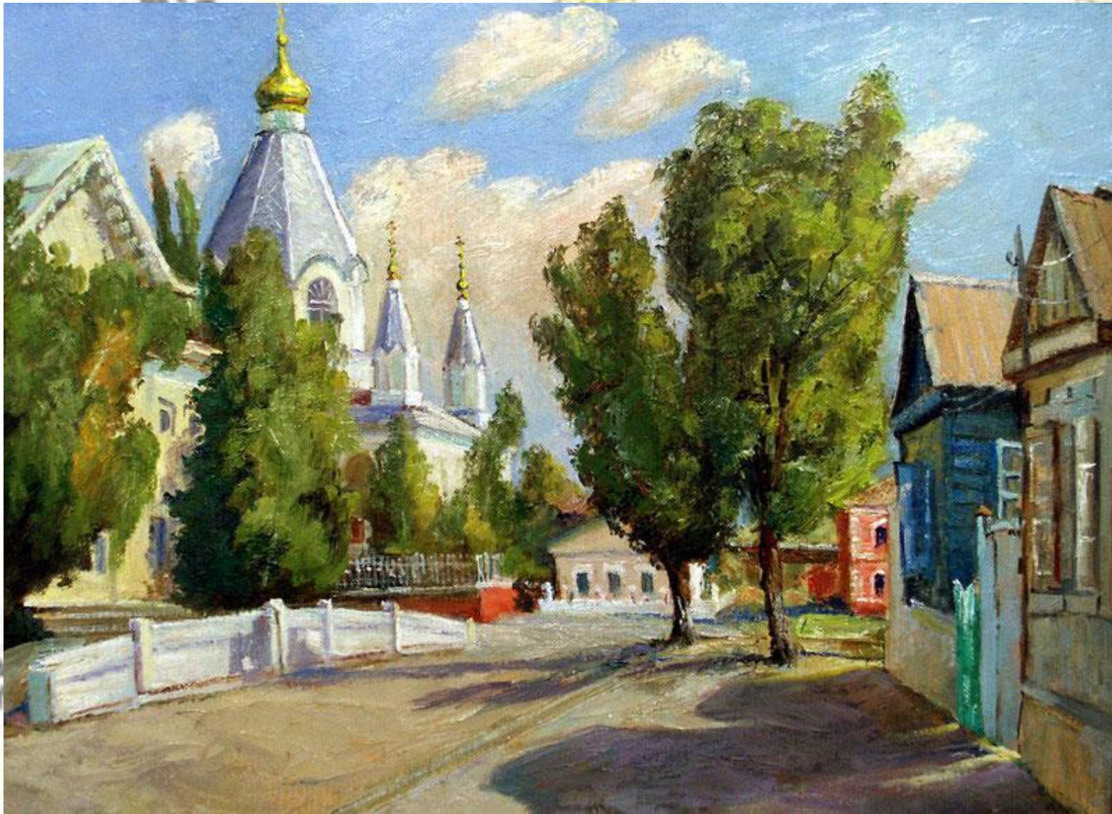
«Донской край» картина художника Юрия Измайлова