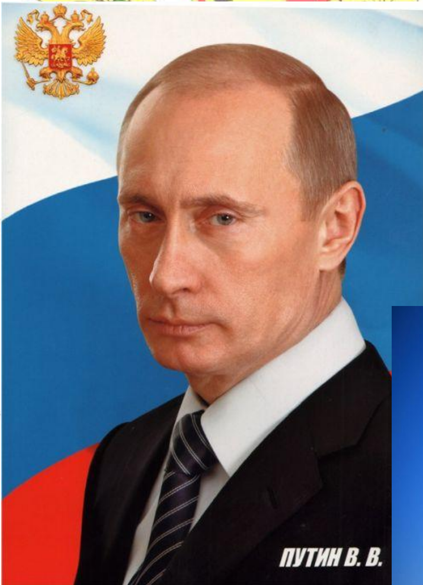
ПУТИН В. В.