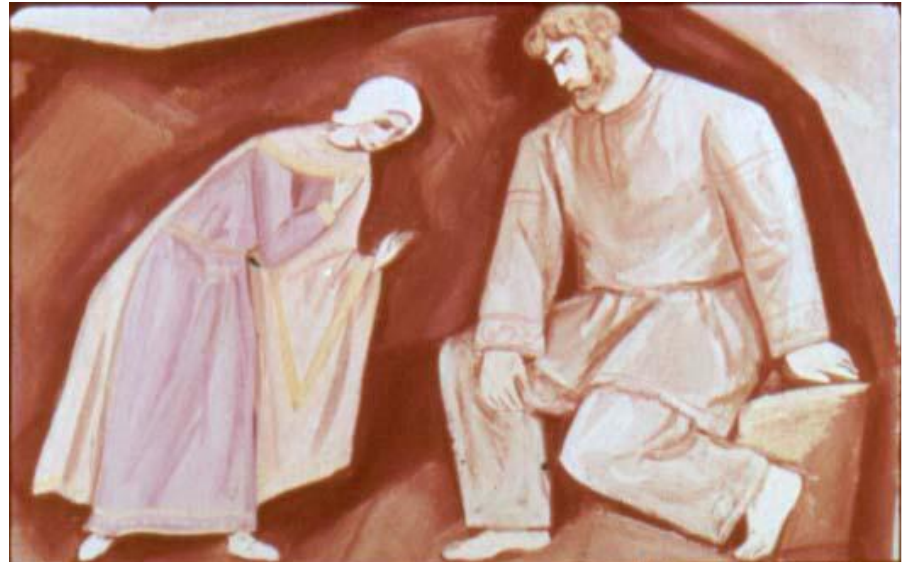
Подошла тут княжеская дочь, поклонилась Илье Ивановичу: „Не для князя, не для нягини, а для бедных вдов, для малых детей—ты постой за русских людей, за родную Русь!“

Все за столом призамолкнули: Меньший хоронится за большего. Большой хоронится за меньшаго, А от меньшаго мал ответ живет.