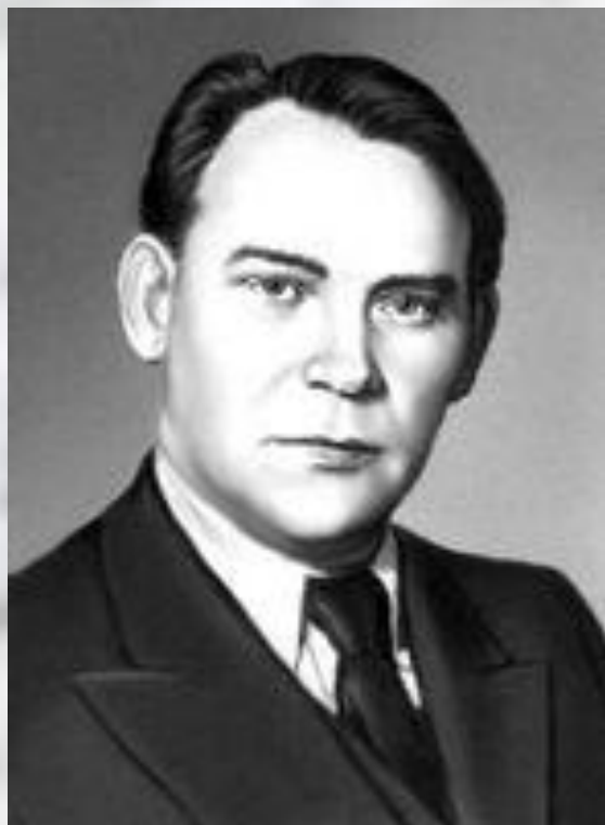
Музыка А. Г. Новикова