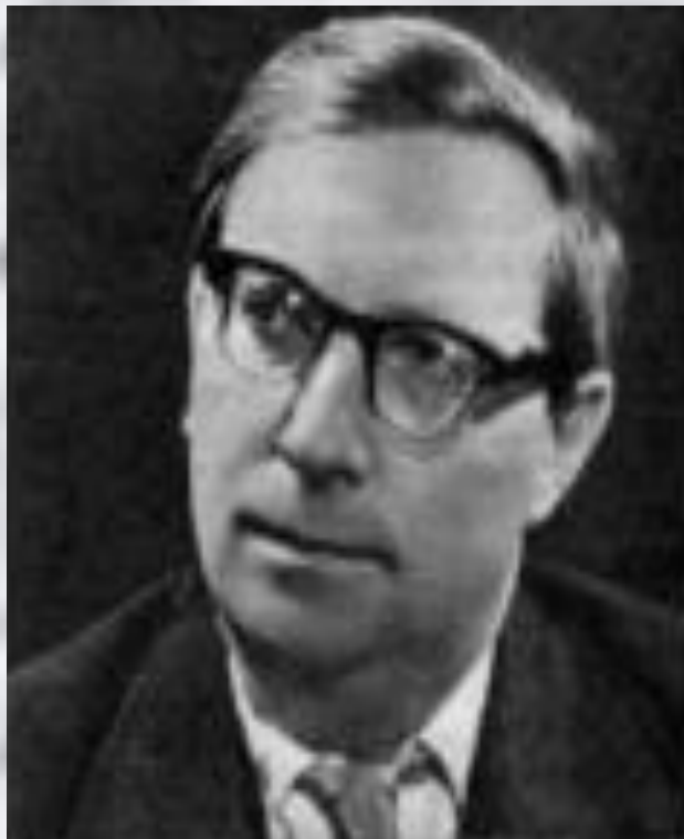
Слова Л. И. Ошанина