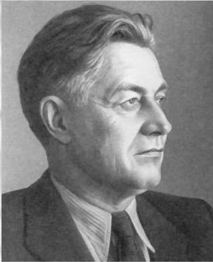
Слова А. А. Суркова