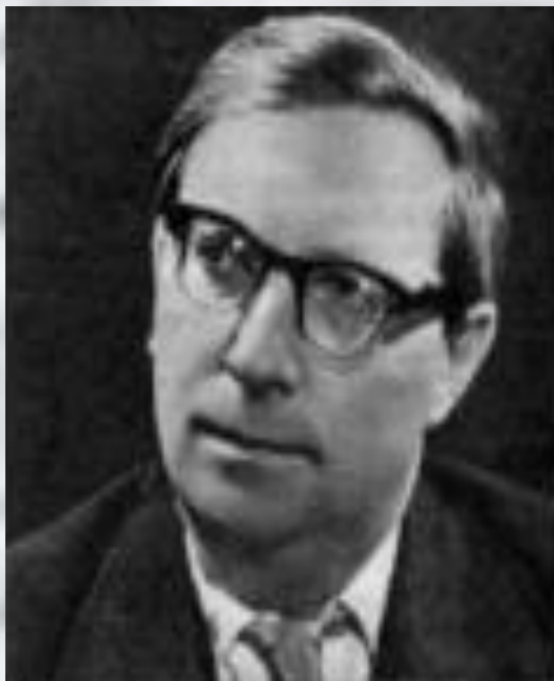
Слова Л. И. Ошанина