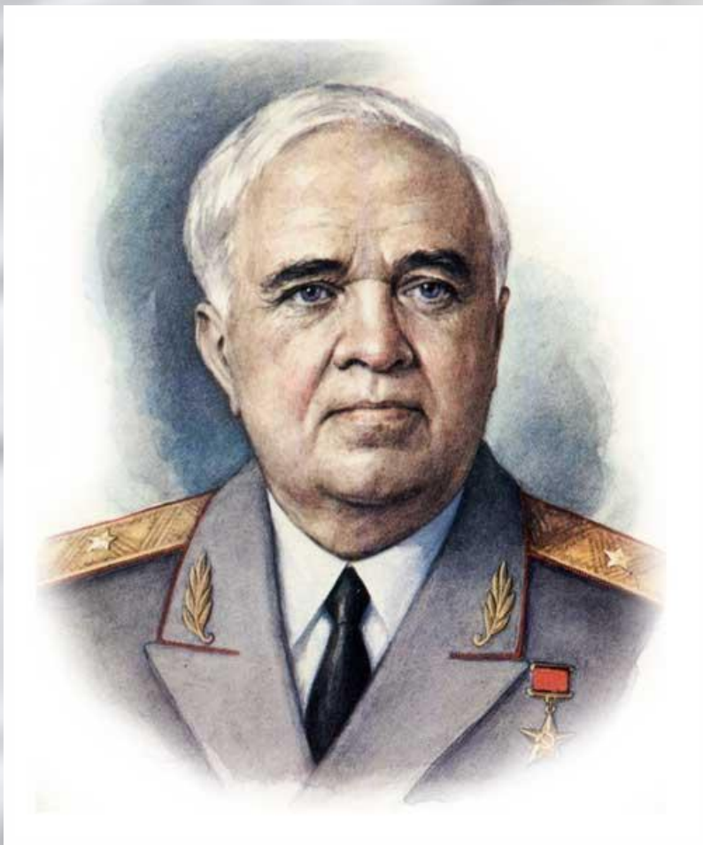
А. В. Александров

“Внезапное нападение вероломного врага на нашу Родину вызвало во мне, как и во всех советских людях, чувство возмущения и гнева. ...но у меня всё-таки оказалось могучее оружие в руках, это – песня. Песня, которая так же может разить врага. Как и любое оружие...”