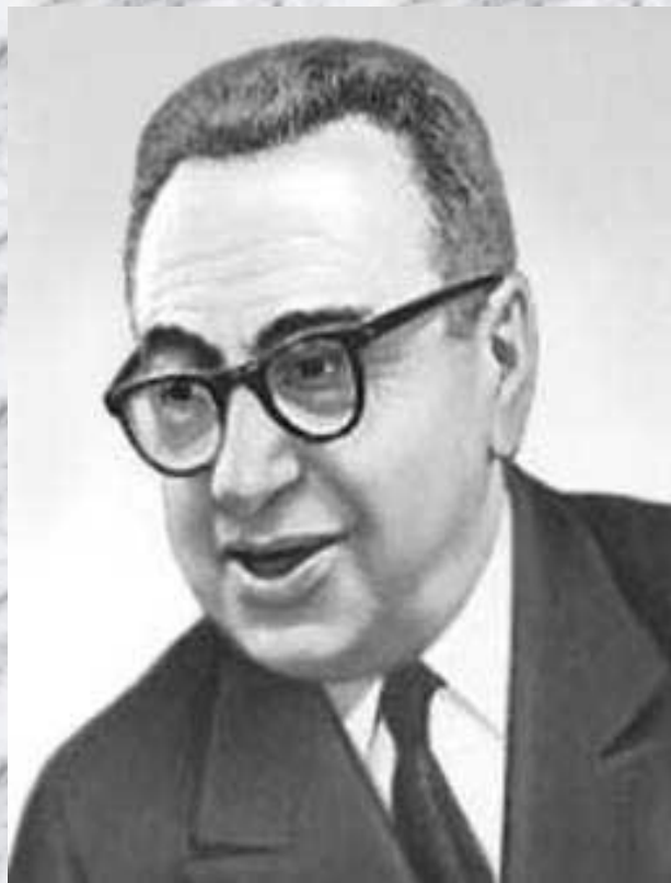
Музыка М. Блантера