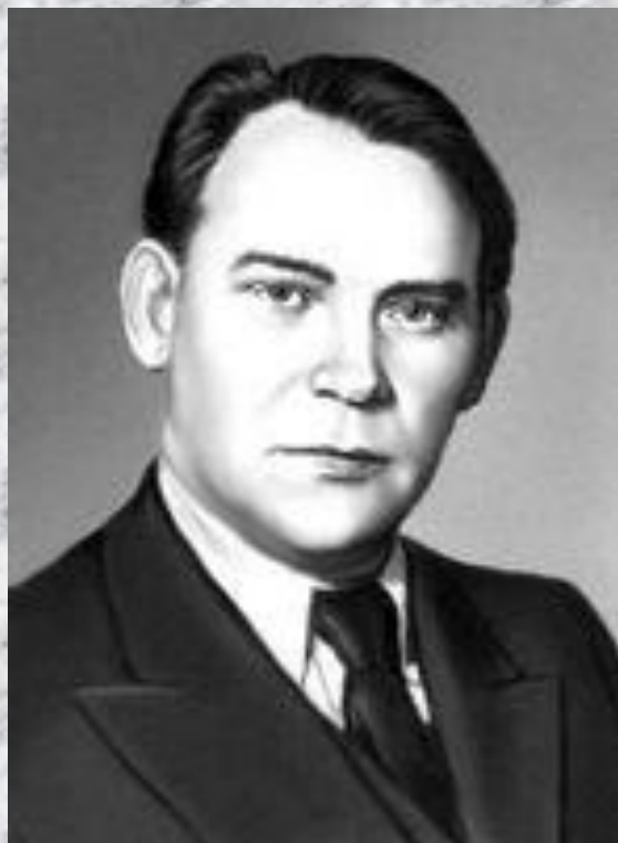
Музыка А. Г. Новикова