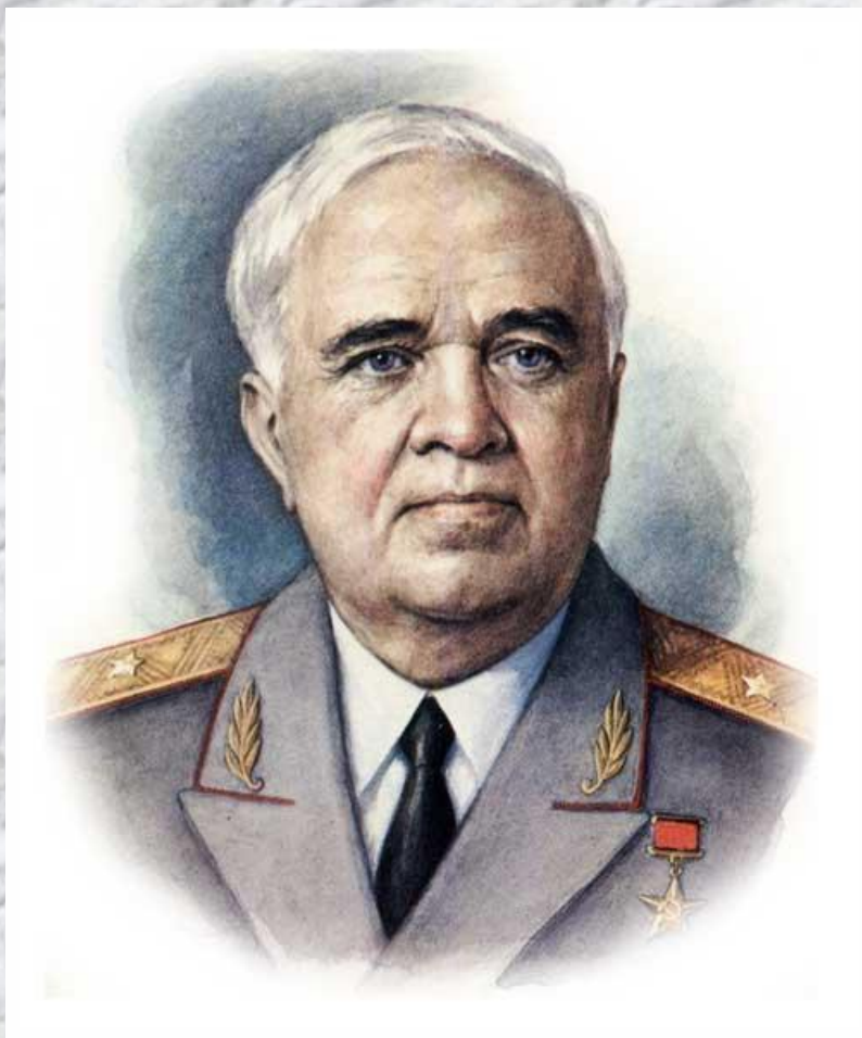
А. В. Александров

“Внезапное нападение вероломного врага на нашу Родину вызвало во мне, как и во всех советских людях, чувство возмущения и гнева. ...но у меня всё-таки оказалось могучее оружие в руках, это – песня. Песня, которая так же может разить врага. Как и любое оружие...”