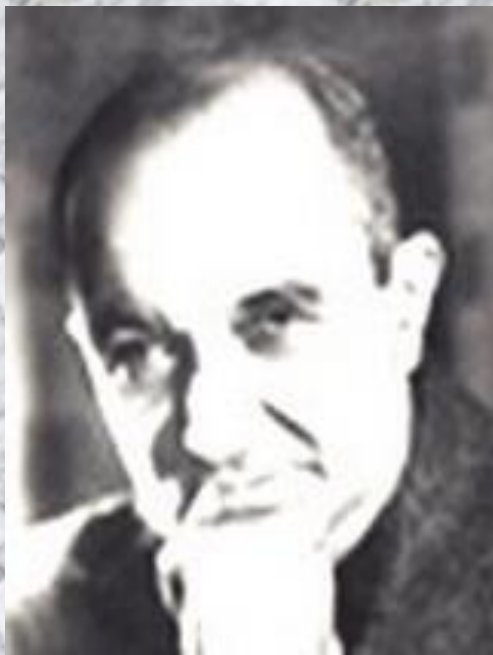
Слова В. Агатова