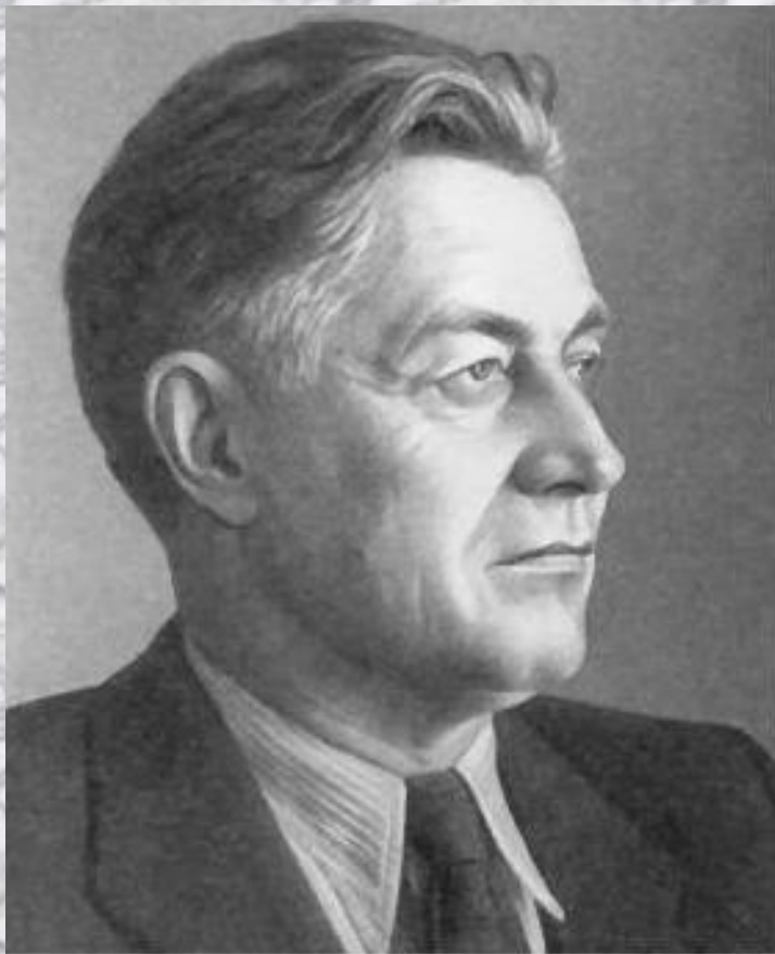
Слова А. А. Суркова