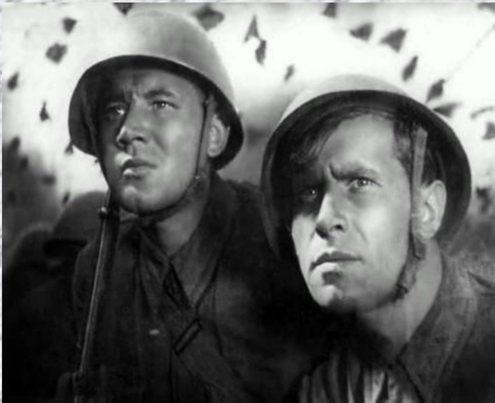
Из к/ф «Два бойца»

История создания всенародно любимой песни «Тёмная ночь» очень интересна. В 1943 году, во время работы над знаменитым к/ф «Два бойца» у режиссёра Леонида Лукова не получалось снять эпизод написания солдатом письма. Расстроенному режиссёру неожиданно пришла мысль, что украшением сцены могла бы стать песня, передающая чувства бойца в момент написания письма родным. Леонид Луков поспешил к композитору Никите Богословскому. И уже через 40 минут мелодия была готова. После этого оба приехали к поэту Владимиру Агатову, который, в свою очередь, за пару-тройку часов написал легендарное стихотворение. Так была создана любимая и поныне песня «Тёмная ночь».