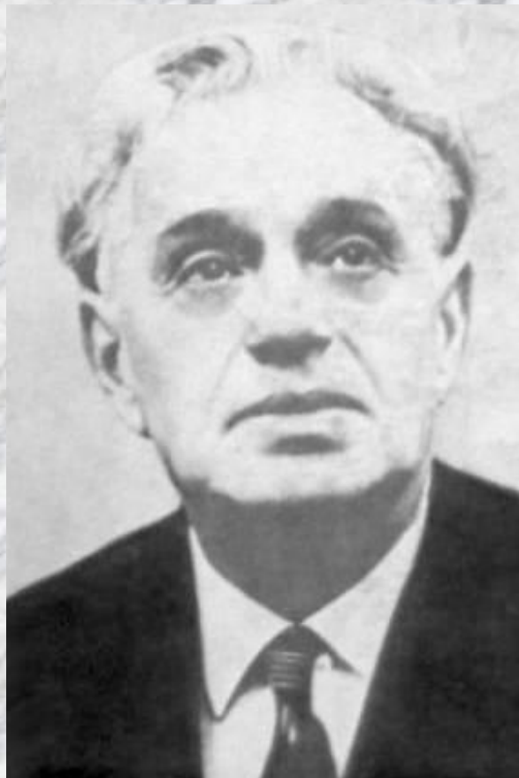
Музыка К. Листова