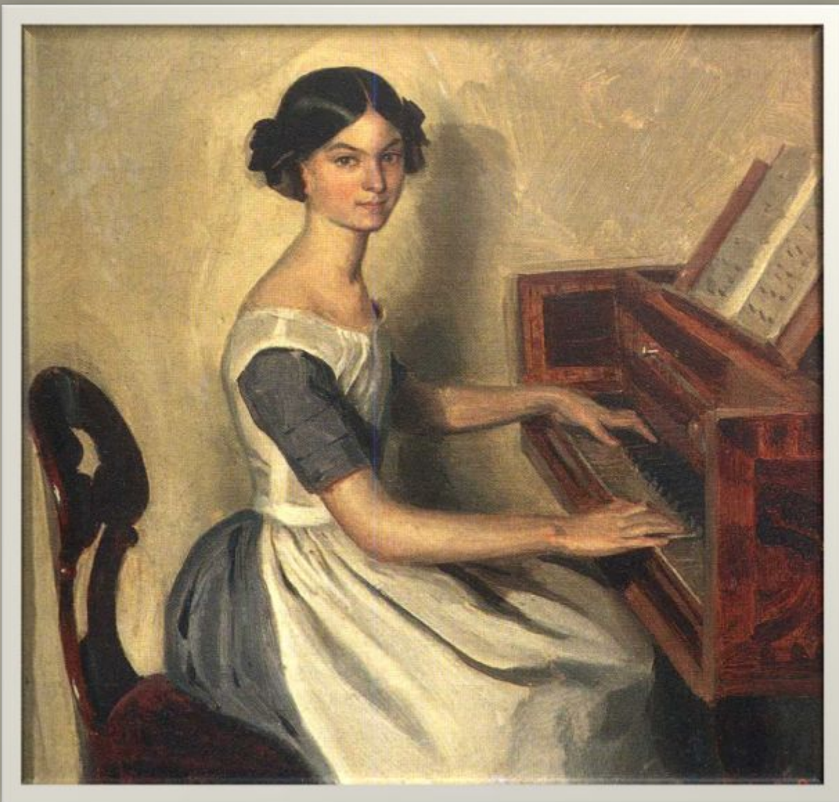
Павел Федотов «Девушка за фортепьяно»