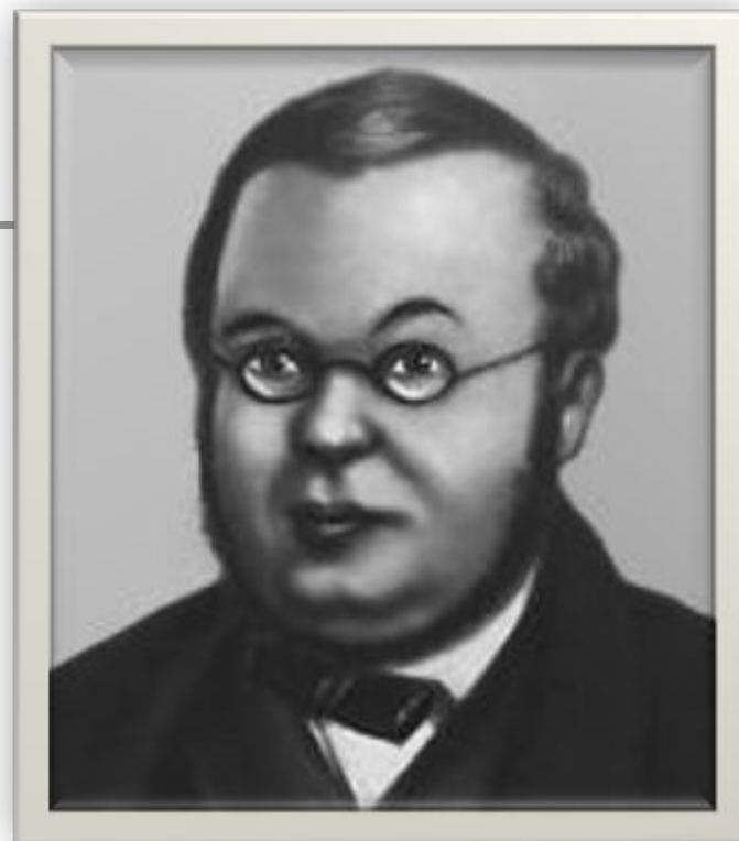
ЕРШОВ Петр Павлович