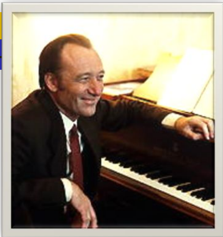
ЩЕДРИН Родион Константинович