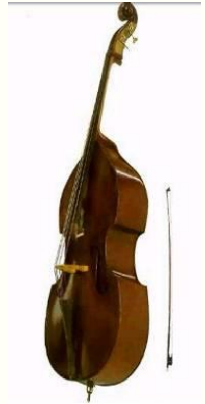
скрипка альт виолончель контрабас