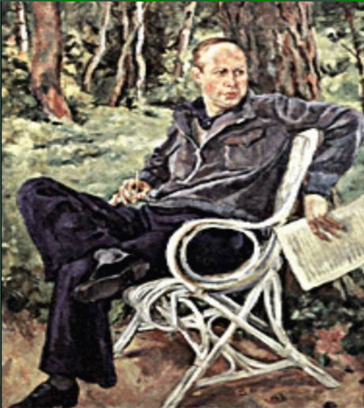
Сергей Сергеевич Прокофьев (1891-1953)