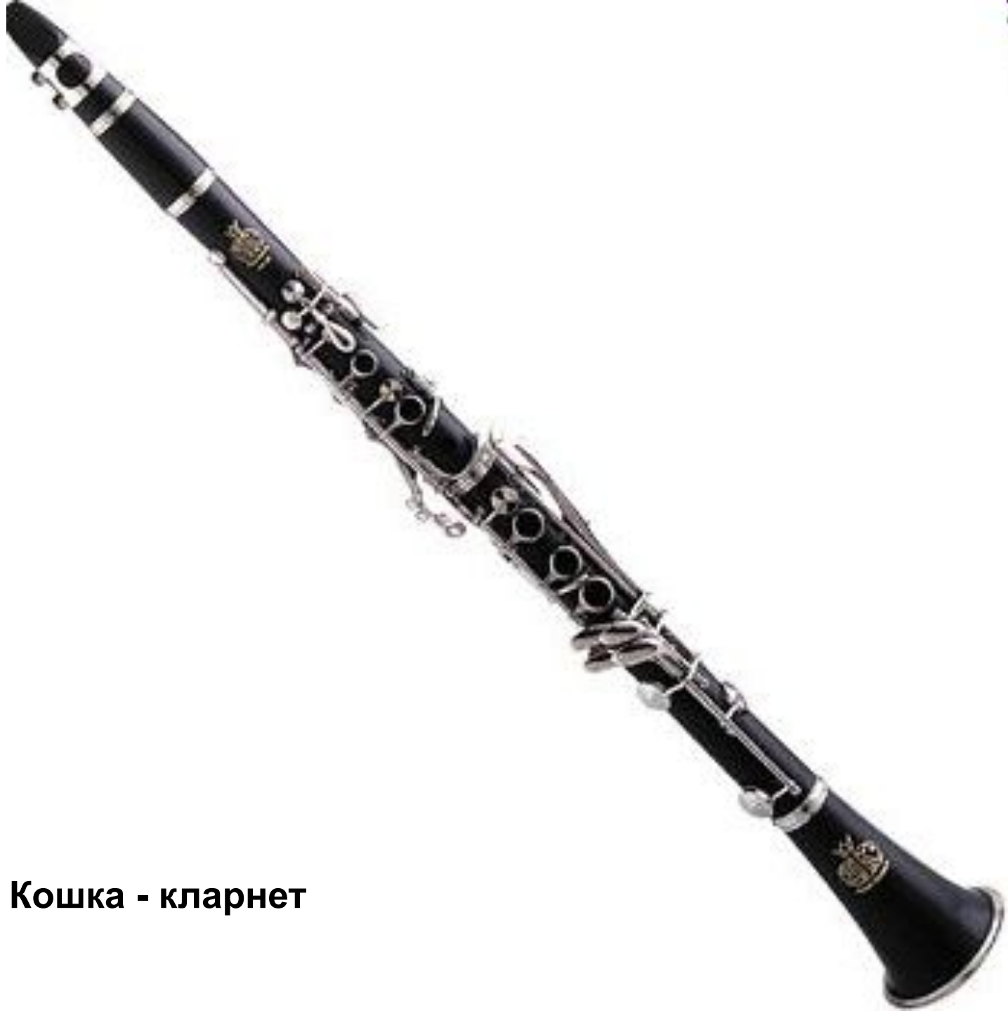
Кошка - кларнет