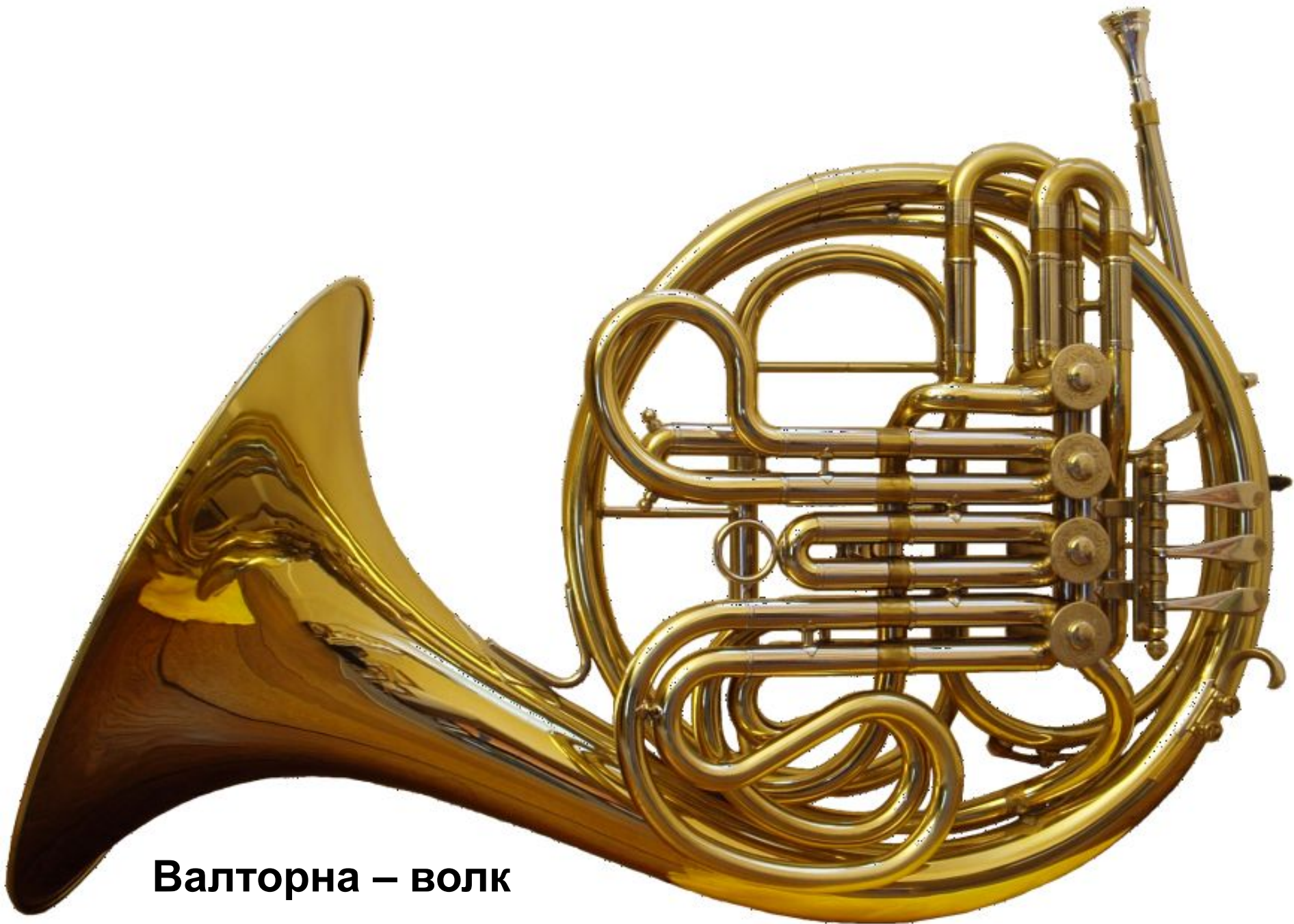
Валторна – волк