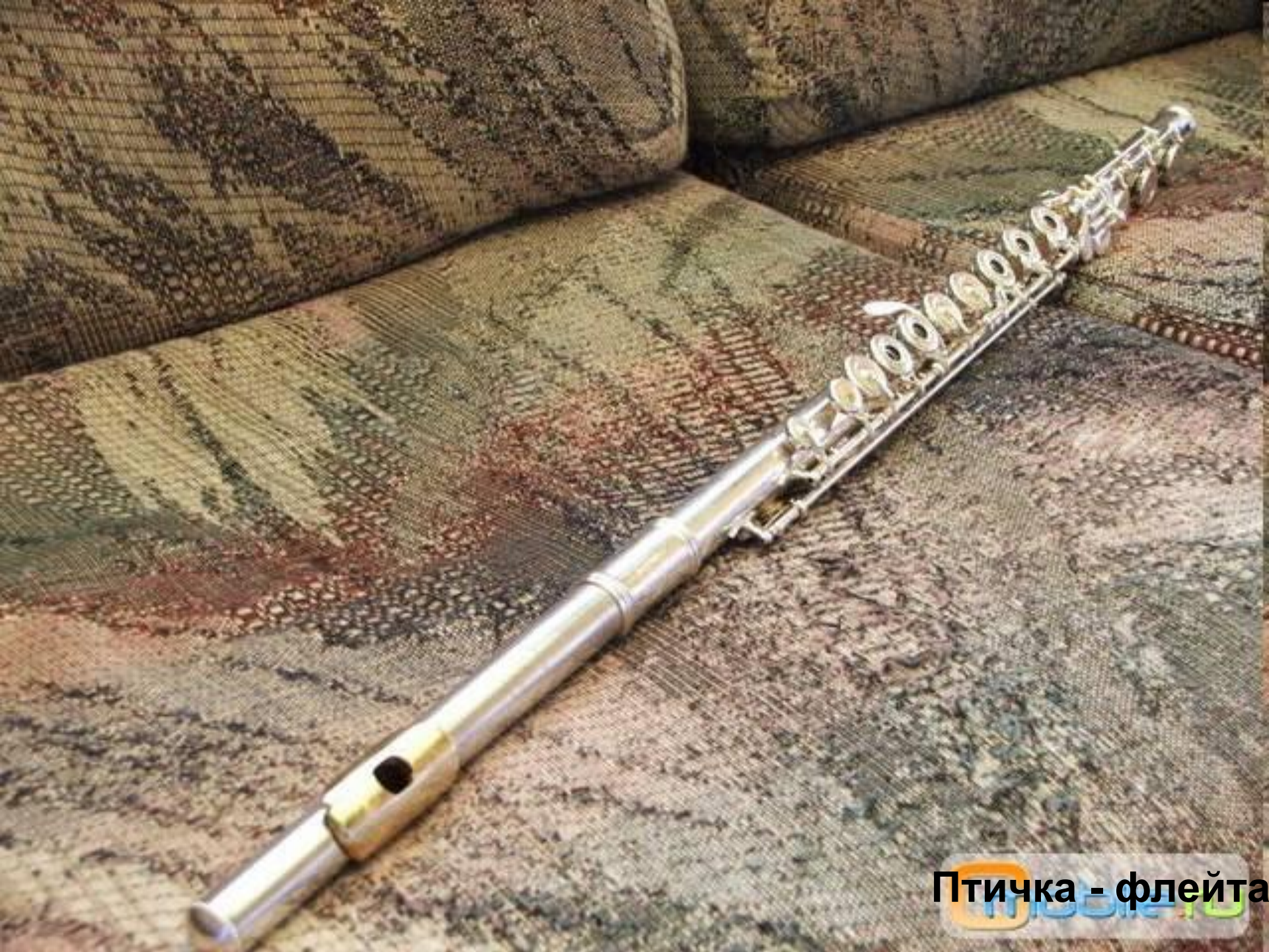
Птичка - флейта