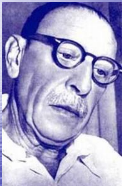
Игорь Стравински й

«Цветок настолько прекрасен, что не может не найти своего воплощения в искусстве».