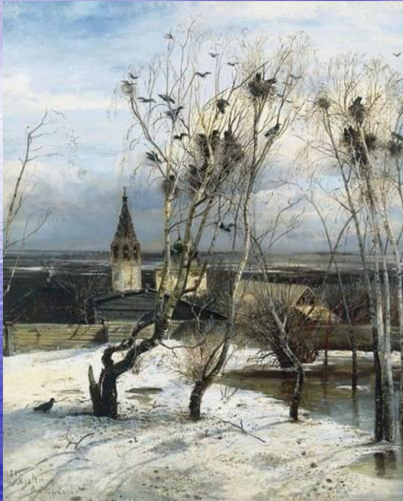
Алексей Саврасов. Живопись. Грачи припели 1871