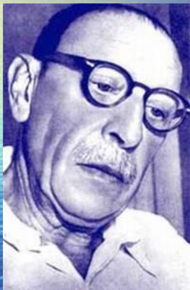
Игорь Стравински й

«Цветок настолько прекрасен, что не может не найти своего воплощения в искусстве».