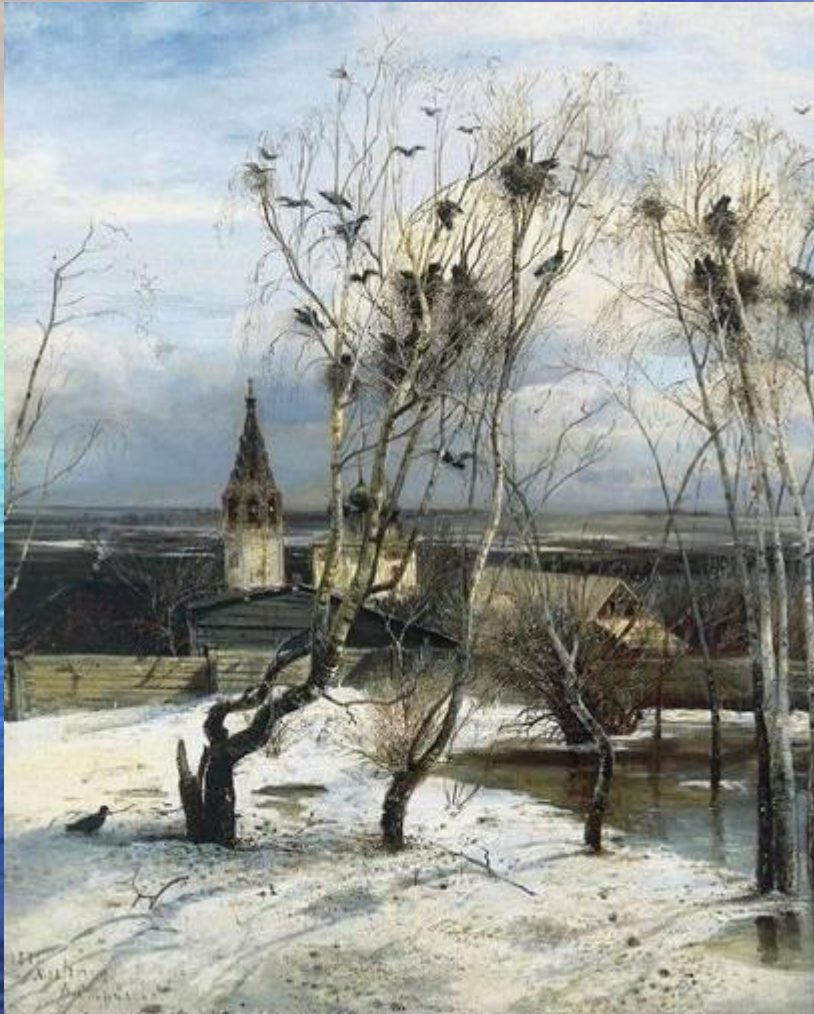
Алексей Саврасов. Живопись. Грачи припели, 1871