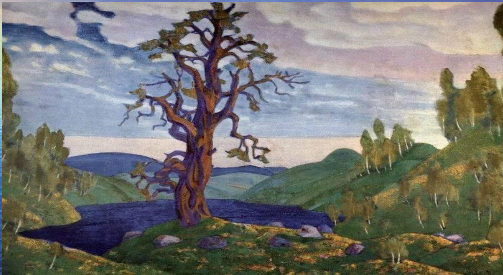
Николай Рерих. Галерея картин художника - Поцелуй земле

«Пейзаж не имеет цели, если он только красив. В нём должна быть история души. Он должен быть звуком, отвечающим сердечным чувствам. Это трудно выразить словом, это так похоже на музыку». Алексей Саврасов