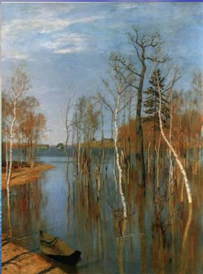
Весна – большая вода

«Протокольная правда никому не нужна. Важна ваша песня, в которой вы поёте лесную или садовую тропинку».