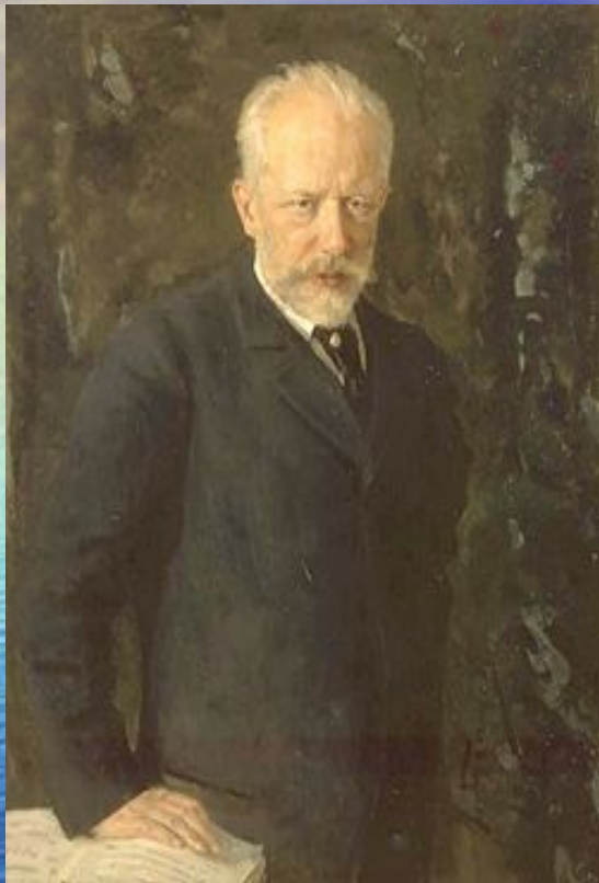
Пётр Ильич Чайковский