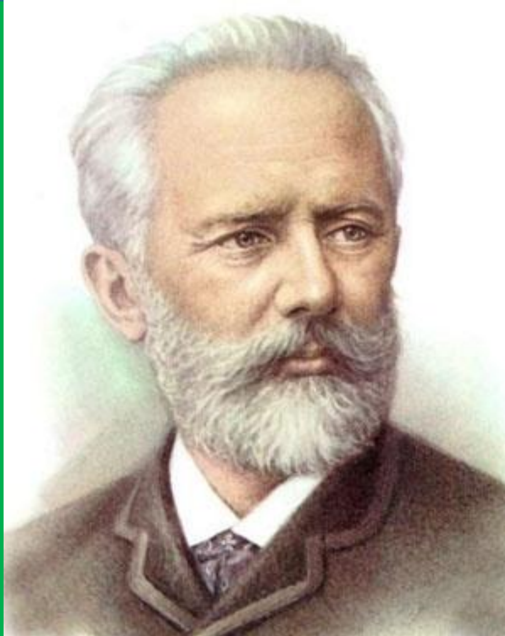
П. І. Чайковський