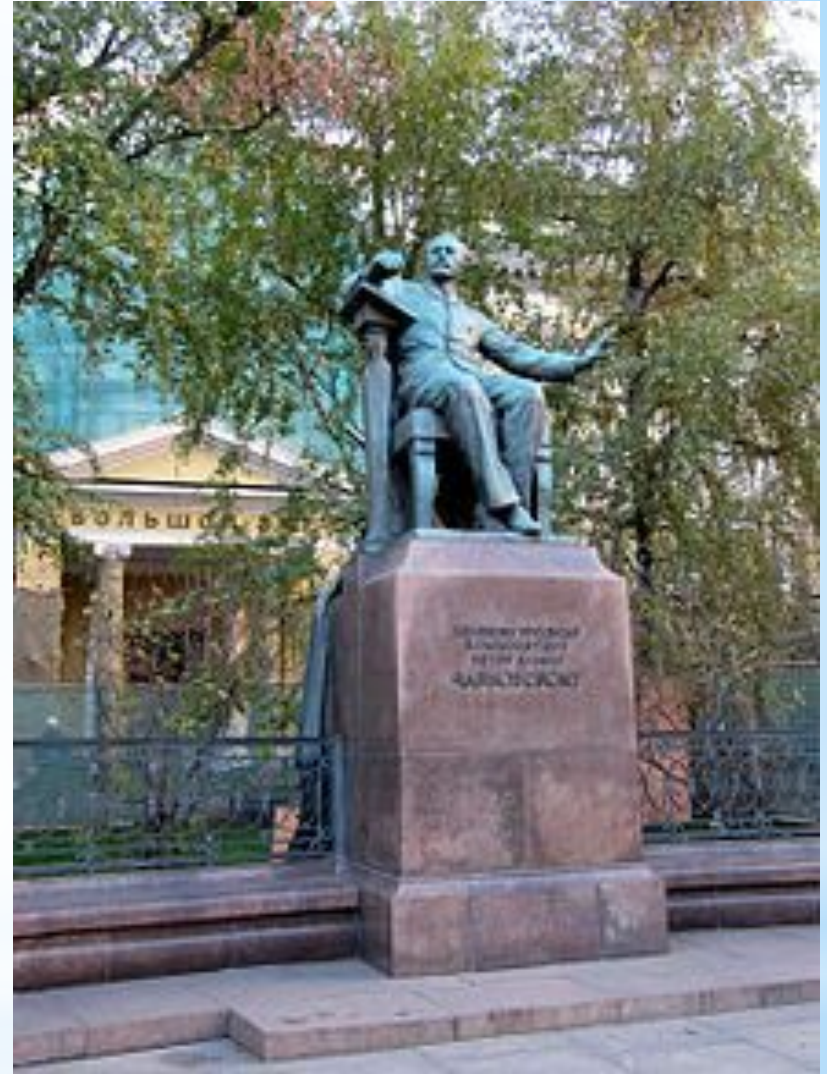
Памятник Петру Чайковскому перед Московской Государственной Консерваторией