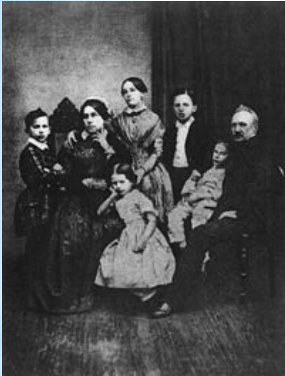
Семья Чайковских в 1848 году (крайний слева — Пётр Ильич)