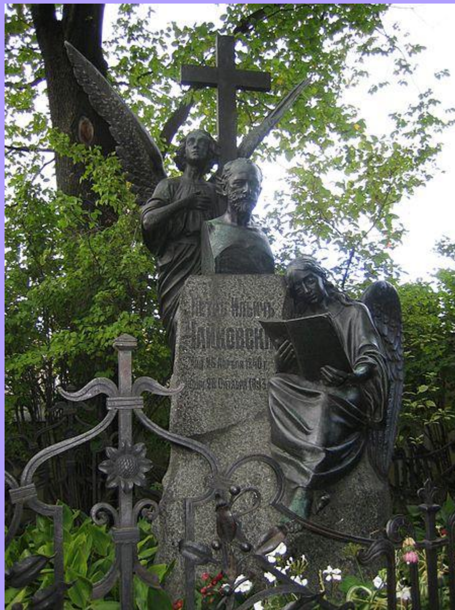
Надгробие композитора на Тихвинском кладбище в Санкт-Петербурге