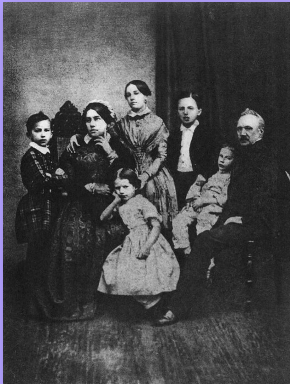
Семья Чайковских в 1848 году (крайний слева — Пётр Ильич)