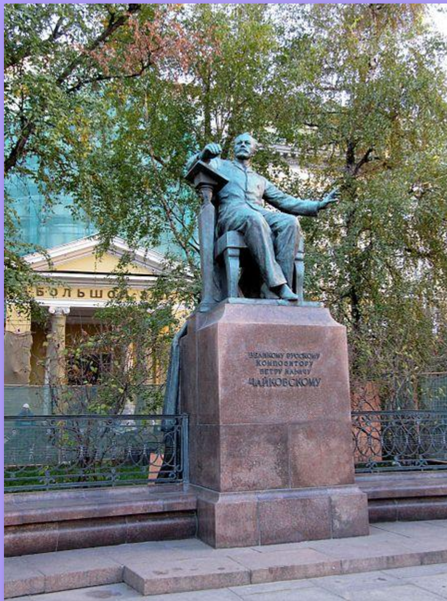
Памятник Петру Чайковскому перед Московской Государственной Консерваторией