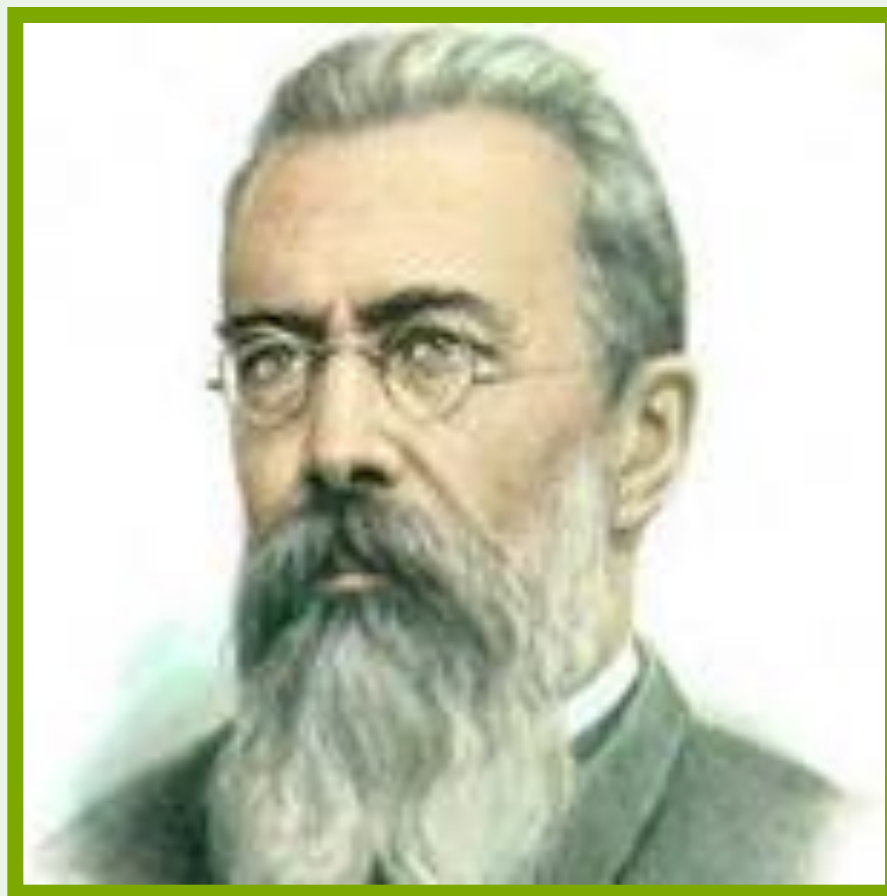
Н. А. Римский-Корсаков опера «Снегурочка»