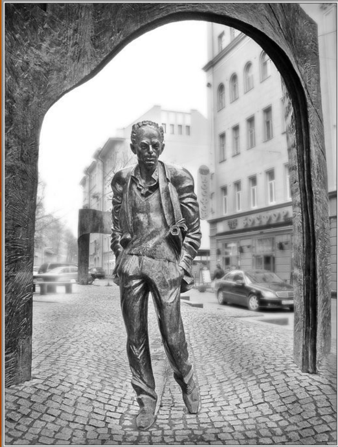
Памятник Булату Окуджаве на Старом Арбате