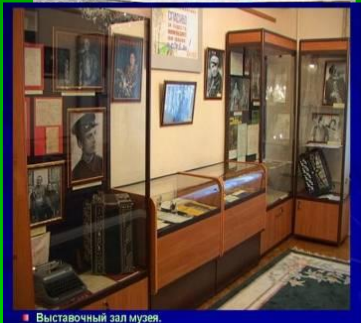
■ Выставочный зал музея.