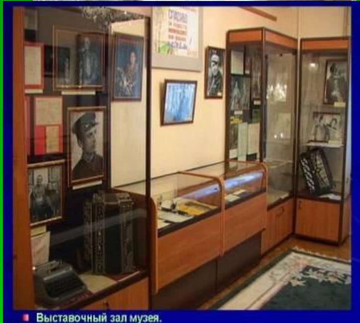
■ Выставочный зал музея.