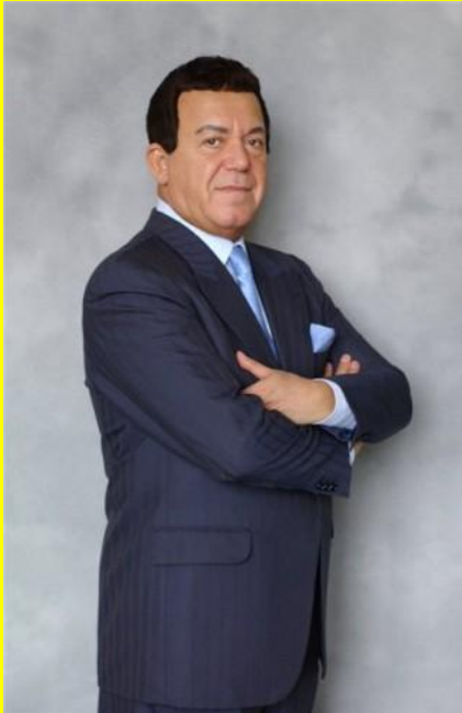
Иосиф Кобзон - заслуженный артист СССР