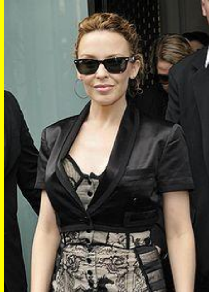
Кайли Энн Минóуг