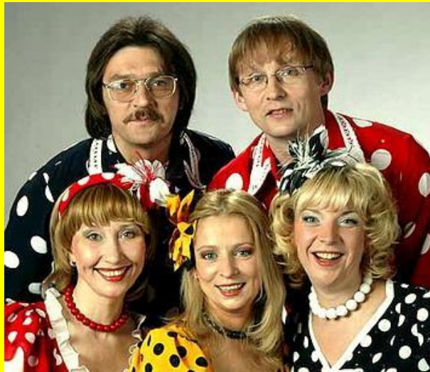
Группа Группа "Группа Чё те надо Гру ппа "Чё те надо" "Балаган