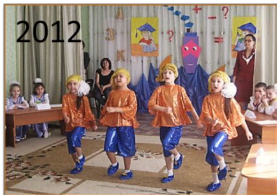
Интеллектуальная игра «Что, где, когда?»