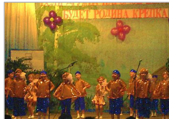
Участие в творческом отчете сельских поселений.