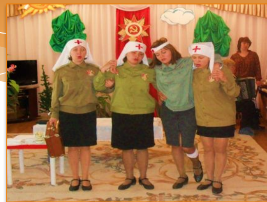
Инсценированная песня «Конь» муз. Ю.Морозова.