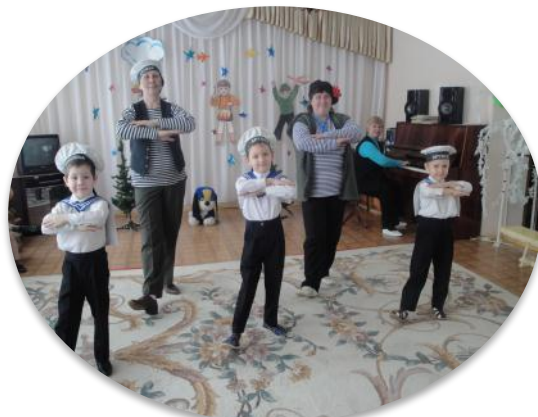
Матросский танец «Яблочко»