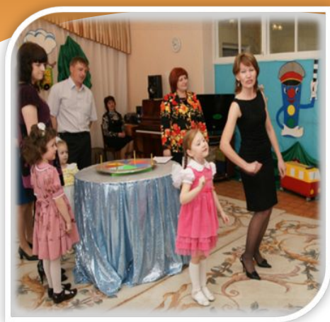
Конкурс «Поле чудес»